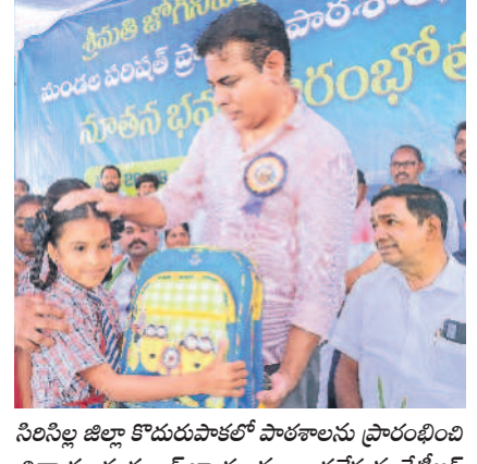
సిరిసిల్లా జిల్లా కొడుగుపాకలో పాఠశాలను ప్రారంభించి విన్నూరలకు సూల్ బ్యాగులను అందజేస్తున్న కేటీఆర్

హైదరాబాద్, సెప్టెంబర్ 26 (నమస్తే తెలంగాణ): ఫార్మాసిటీ ప్రభుత్వం స్పష్టమైన ప్రకటన చేయాలని, అది ఉంటుందో, లేదో చెప్పాలని టీఆర్ఎస్ పార్టీకి డిమాండ్. డిమాండ్ కేటీఆర్ డిమాండ్ చేశారు. ఫార్మాసిటీపై ఫోర్ట్ సిటీ పేరు వచ్చినట్లు తెలియజేయాలని కోరారు. అలా చేయకుంటే అది ముమ్మారికి టీటీఎన్ కిందికి వస్తుంది. ఇలాంటి నేరానికి పాల్పడుతున్న రాష్ట్ర సర్కారుకు తగిన గుణపాఠం తప్పదని హెచ్చరించారు. కేవలం తన సోదరులకు, అసయాయుకు వేల కోట్ల రూపాయల లబ్ధి చేకూర్చే కుంభకోణంలో భాగంగానే 'రేపంకెరెడ్డి' ఇదంతా చేస్తున్నారని ఆరోపించారు. ఫార్మాసిటీ >5 పేజీలో