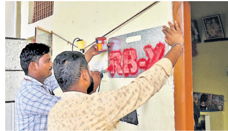
మూసీ తీరంపైకి బుల్డోజర్ దాడు తీయస్తున్న సర్కార్ పాలమూరు తరహాలో మరిన్ని జిల్లాల్లో కూల్చివేతలు ఎందరి ఉసురుపోస్తుంటే కాంగ్రెస్ కండ్లు సల్లబడ్డయ్యే ఆగ్రహంతో రగిలిన జనం.. ప్రభుత్వంపై శాపనారాలు