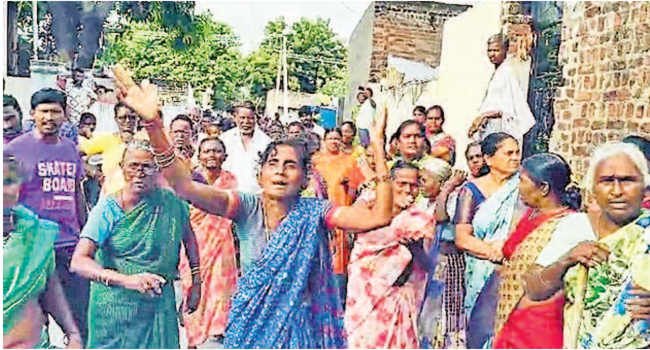
సూర్యాపేట జిల్లా కేంద్రంలోని పలు కాలనీల్లో ఇండ్ల కూల్చివేతకు అధికారులు ఏర్పాట్లు చేస్తున్నారు. గురువారం నెహ్రూనగర్ లో సర్వే కోసం వెళ్లిన అధికారులను స్థానికులు అడ్డుకుని, వెనక్కి పంపారు. 'ఇండ్ల సర్వే అంటూ వస్తే కంట్లల్లో కారం కొడుతం' అని హెచ్చరించడంతోపాటు ప్రభుత్వంపై దుమ్మెత్తి పోస్తున్న మహిళలు

మూసీ తీరంపైకి బుల్డోజర్ దాడు తీయస్తున్న సర్కార్ పాలమూరు తరహాలో మరిన్ని జిల్లాల్లో కూల్చివేతలు ఎందరి ఉసురుపోస్తుంటే కాంగ్రెస్ కండ్లు సల్లబడ్డయ్యే ఆగ్రహంతో రగిలిన జనం.. ప్రభుత్వంపై శాపనారాలు