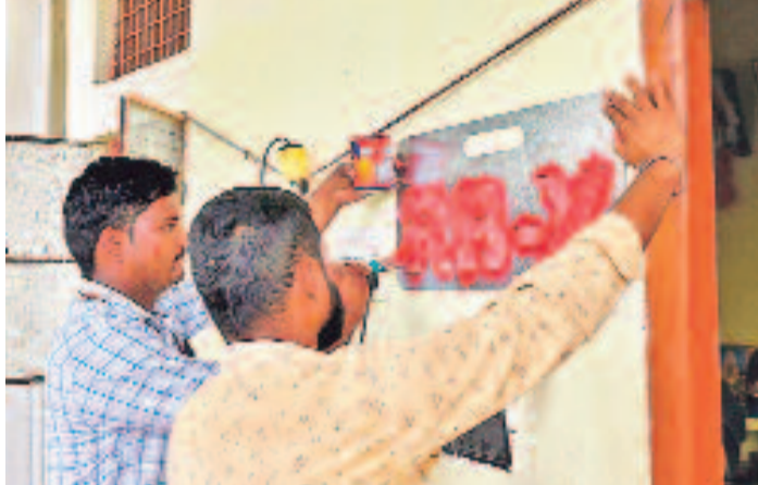
మూసీ తీరంపైకి బుల్డోజర్ దాడు తీయస్తున్న సర్కార్ పాలమూరు తరహాలో మరిన్ని జిల్లాల్లో కూల్చివేతలు ఎందరి ఉసురుపోస్తుంటే కాంగ్రెస్ కండ్లు సల్లబడ్డయ్యే ఆగ్రహంతో రగిలిన జనం.. ప్రభుత్వంపై శాపనారాలు