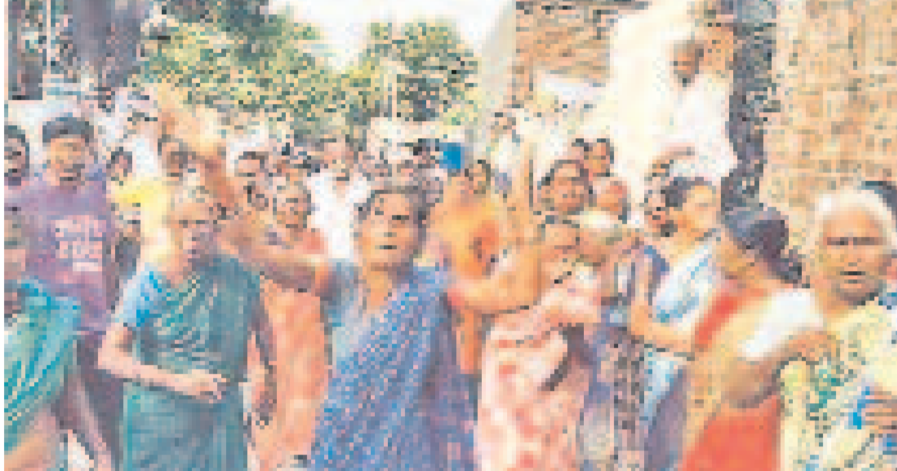
సూర్యాపేట జిల్లా కేంద్రంలోని పలు కాలనీల్లో అక్రమణల కూల్చివేతకు అధికారులు ఏర్పాట్లు చేస్తున్నారు. గురువారం నెహ్రూనగర్లో సర్వే కోసం వెళ్లిన అధికారులను స్థానికులు అడ్డుకుని, వెనక్కి పంపారు. 'ఇండ్ల సర్వే అంటూ వస్తే కండ్లల్లో కారం కొడుతం' అంటూ తీవ్రంగా హెచ్చరిస్తున్న మహిళలు

మూసీ తీరంపైకి బుల్డోజర్ దాడు తీయస్తున్న సర్కార్ పాలమూరు తరహాలో మరిన్ని జిల్లాల్లో కూల్చివేతలు ఎందరి ఉసురుపోస్తుంటే కాంగ్రెస్ కండ్లు సల్లబడ్డయ్యే ఆగ్రహంతో రగిలిన జనం.. ప్రభుత్వంపై శాపనారాలు