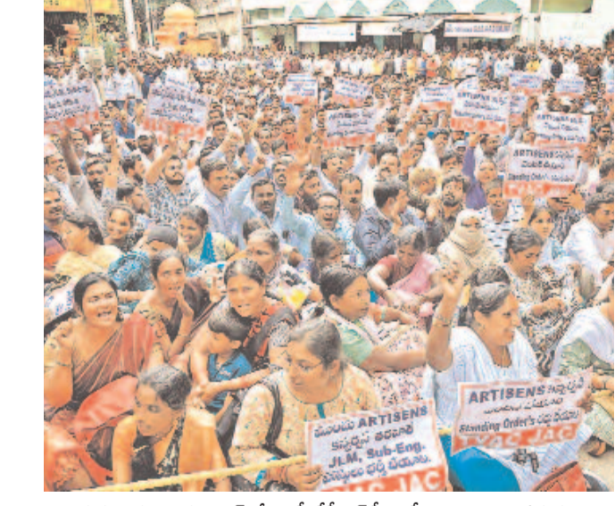
గురువారం హైదరాబాద్ లోని ఎస్.డి.సీ.ఎల్.సీ.ఎల్. కార్యాలయం వద్ద ధర్నా చేస్తున్న తెలంగాణ విద్యుత్తు ఆర్టిజన్స్ కన్ఫెడరేషన్ ఉద్యోగులు

రామప్ప వద్ద వైనింగ్ తో పెనుముప్పు.. రామప్ప చెరువు, కోటగుళ్లు, లక్కవరం, మేడారంపైనా 'ఓపెన్ కాస్ట్' ప్రభావం ఇప్పటిదాకా ఎటుచూసినా ఆపదదకరం.. తెలంగాణకు తలమానికంగా వర్కాటక ప్రాంతం.. బొగ్గుగనితో బొందలగడ్డగా మారే ప్రమాదం మట్టికొండలతో పాటు ఉన్న వరద ముంపు.. పర్యావరణం, ఊరు, అన్నీ తారుమారు.. చెట్లు, గుట్టలు కొద్దిరోజుల్లోనే మాయం