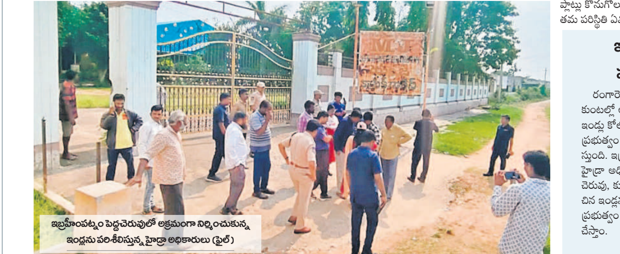
ఇల్లహంపట్టుం పెద్దచెరువులో అక్రమంగా నిర్మించుకున్న ఇండ్లను పరిశీలిస్తున్న హైద్రా అధికారులు (ఫైల్)