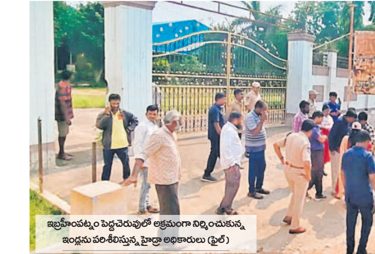
ఇబ్రహీంపట్నం పెద్దచెరువులో ఆక్రమణగా నిర్మించుకున్న ఇండ్లను పరిశీలిస్తున్న హైద్రా అధికారులు (ఫైల్)

రంగారెడ్డి జిల్లాలో చెరువు, కుంటల్లో ఆక్రమణగా నిర్మించిన ఇండ్లు కోల్పోతున్న వారికి ప్రభుత్వం పునరావాసం కల్పిస్తుంది. ఇబ్రహీంపట్నం చెరువును హైద్రా అధికారులు పరిశీలించారు. చెరువు, కుంటల్లో ఆక్రమణగా నిర్మించిన ఇండ్లను కూల్చివేయనున్నారు. అర్హులైన వారందరికీ ప్రభుత్వం డబుల్ బెడ్ రూం ఇండ్లను ఇచ్చి న్యాయం చేస్తాం. - మల్లెరెడ్డి రంగారెడ్డి, ఇబ్రహీంపట్నం ఎమ్మెల్యే