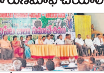
సమావేశంలో మాట్లాడుతున్న రైతు సంఘాల నాయకులు

నిధిపేట, సెప్టెంబర్ 25 : మాజీమంత్రి ఎమ్మెల్యే హాజీరావు పాఠశాలలో మంచి పేరు వచ్చిందన్నారు. ప్రపంచ దేశాల్లో సాఫ్ట్వేర్ ఇంజనీర్లకు పెద్ద పెద్ద ఉద్యోగాల్లో ఉద్యోగం వచ్చింది. అనుభవం అధ్యయనం చేయడం చేశారు. పుస్తకాలు లేకుండా రుణమామీ చేయాలని డిమాండ్ చేస్తూ భారతీయ కిసాన్ సంఘం ఆధ్వర్యంలో పట్టణంలోని ఎంఎన్ గార్డెన్ బుధవారం హాజీరావు సమావేశాన్ని నిర్వహించారు. ఈ సందర్భంగా వివిధ రైతు సంఘాల నాయకులు పాల్గొని మాట్లాడారు. పుస్తకాలు లేకుండా రు.2 లక్షల