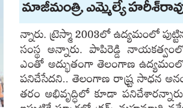
మాజీమంత్రి ఎమ్మెల్యే హాజీరావు

నిధిపేట, సెప్టెంబర్ 25 : మాజీమంత్రి ఎమ్మెల్యే హాజీరావు పాఠశాలలో మంచి పేరు వచ్చిందన్నారు. ప్రపంచ దేశాల్లో సాఫ్ట్వేర్ ఇంజనీర్లకు పెద్ద పెద్ద ఉద్యోగాల్లో ఉద్యోగం వచ్చింది. అనుభవం అధ్యయనం చేయడం చేశారు. పుస్తకాలు లేకుండా రుణమామీ చేయాలని డిమాండ్ చేస్తూ భారతీయ కిసాన్ సంఘం ఆధ్వర్యంలో పట్టణంలోని ఎంఎన్ గార్డెన్ బుధవారం హాజీరావు సమావేశాన్ని నిర్వహించారు. ఈ సందర్భంగా వివిధ రైతు సంఘాల నాయకులు పాల్గొని మాట్లాడారు. పుస్తకాలు లేకుండా రు.2 లక్షల