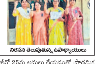
నిరసన తెలుపుతున్న ఉపాధ్యాయులు