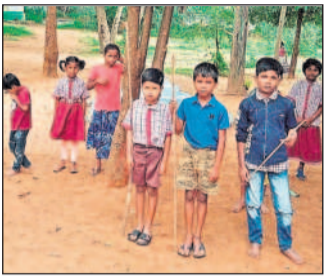
కోతుల భయంతో పాఠశాలలో బెత్తం పట్టుకున్న విద్యార్థులు

కొమురవెల్లి, సెప్టెంబర్ 25 : బడికి పోవాలంటే పలక, బలుపం, లేదా పుస్తకాలు పట్టాలి కానీ కొమురవెల్లి మండలంలోని కిష్టంపేటలో బడికి పోవాలంటే ముందు బెత్తం ఉండాలి. కిష్టంపేటలోని ప్రభుత్వ ప్రాథమిక పాఠశాలలో గతంలో హాజరైనవారికింద నాటిను మొక్కలు విప్పగా పెరుగడంతో గ్రామంలోని కోతుల మండ ఆవిష్కృత మెట్టపెట్టె పాఠశాలలోకి వచ్చి పాఠశాల దాడికి పాల్పడుతున్నాయి. దీంతో పుస్తకాలు తర్రాకో కానీ బడిలోకి పోవాలంటే మాత్రం బెత్తం తప్పనిసరి ఉండాలి. అంతేకాక ఒక్కరు కాకుండా ఇద్దరు, ముగ్గురు ఉంటేనే కోతుల దూరంగా వెళ్ళున్నాయి. దీంతో పాఠశాలకు తమ పిల్లలను తర్రాకోతులు బిచ్చుబిచ్చుమంటూ పంపుతున్నారు. ముఖ్యంగా మధ్యాహ్నం భోజనం