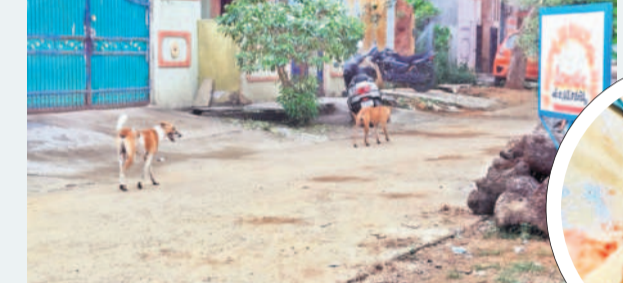
కామారెడ్డిలోని ఓ కాలనీలో తిరుగుతున్న కుక్కలు