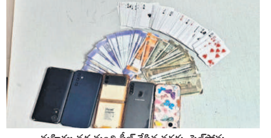
మహిళల వద్ద నుంచి సీజ్ చేసిన నగదు, సెల్ ఫోన్లు