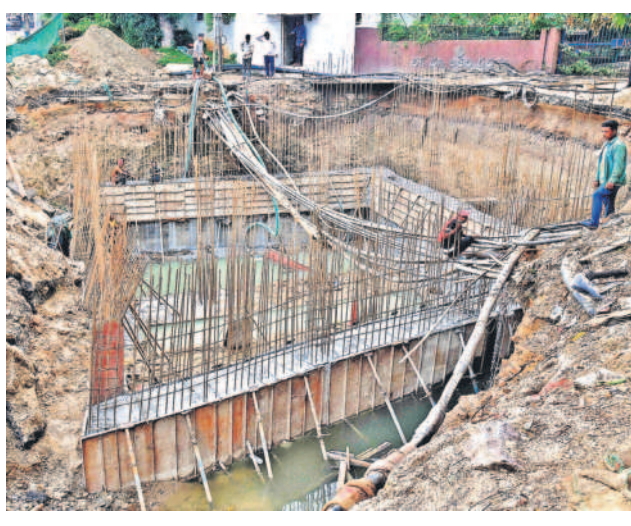
సిటీబ్యూరో, సెప్టెంబర్ 25 (నమస్తే తెలంగాణ)

సిటీబ్యూరో: గ్రేటర్లో వరదల వల్ల ట్రాఫిక్కు ఇబ్బందులు ఏర్పడుతున్న క్రమంలో ప్రధాన రహదారులపై నీరు నిల్వకుండా శాశ్వత పరిష్కారానికి హోల్డింగ్ స్ట్రక్చర్లను ఏర్పాటు చేసేందుకు ప్రతిపాదించినట్లు జిల్లా పరిషత్ కమిషన్ ఆమోదించి ఒక ప్రకటనలో తెలిపారు. నగర వ్యాప్తంగా 18 లోకేషన్లలో 28 వాటర్ హోల్డింగ్ స్ట్రక్చర్ల నిర్మాణాలు చేపట్టామన్నారు. అక్కడ నీరు నిల్వకుండా 154 మానీస్టాన్ ఎమ్మెల్యే బృందం, 252 స్టాటిక్ బృందాలు పనిచేస్తున్నాయని కమిషన్ తెలిపారు. ఇప్పుడున్న 141 మేజర్ వాటర్ లాగింగ్ పాయింట్లను భవిష్యత్లో 50 పాయింట్లతో పరిమితం చేసే దిశగా ప్రణాళికలు రూపొందించాలని ఇంజనీరింగ్ అధికారులను ఆదేశించారు.