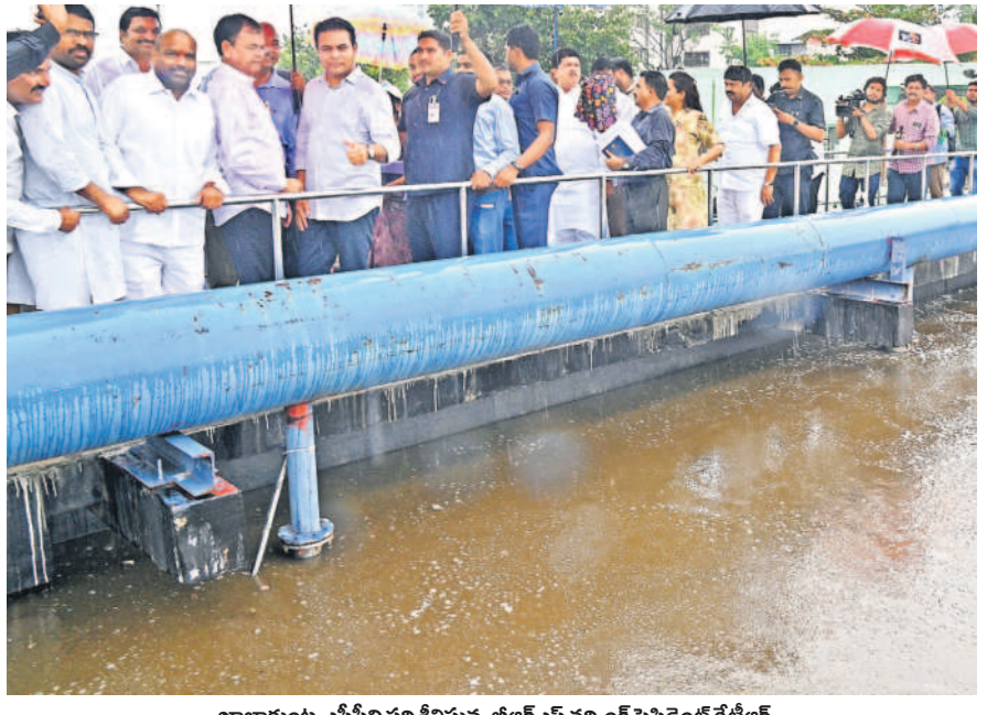
ఖాజూకుండు ఎస్టీసీని పరిశీలిస్తున్న జిల్లా పరిషత్ సభ్యులతో ప్రిసిడెంట్ కేటీఆర్

రోడ్లపై వరద నీరు నిల్వకుండా.. వాటర్ హోల్డింగ్ స్ట్రక్చర్లు