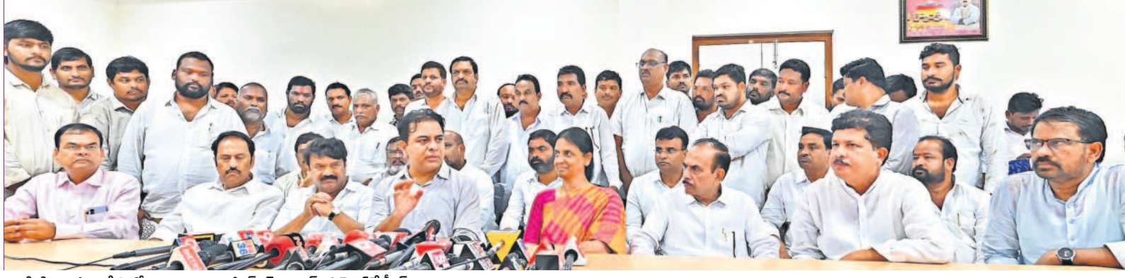
మీడియా సమావేశంలో మాట్లాడుతున్న జిల్లా పరిషత్ సభ్యులతో ప్రిసిడెంట్ కేటీఆర్

పేదల పట్ల హైద్రా ప్రతాపానికి వేదశ్రీ ఒక ఉదాహరణ.. కనీసం పాఠ్య పుస్తకాలు తీసుకునేందుకు కూడా సమయం ఇవ్వకుండా వాళ్ల ఇల్లు కూల్చేశారు. గల్లీ నీ మహిళ ఎంత వేడుకున్నా.. సామగ్రి తీసుకోవడానికి సమయం ఇవ్వలేదు. కస్తూరి అనే మహిళ చెప్పల దుకాణం నడుపుకొంటే ఆమె షాపును తొలగించారు. పేదోళ్ల ఇండ్లు కూల్చేస్తున్న ఘటనలు హృదయ విదారకంగా ఉంటున్నాయి. కాంగ్రెస్ సర్కారు అత్యంత అమానవీయంగా వ్యవహరిస్తున్నది. హైద్రా బాధితులకు న్యాయపరంగా జిల్లా జిల్లా అందంగా ఉంటుంది. మా పార్టీ ఎమ్మెల్యేలు, కార్మిక రేటర్లను వారు సంప్రదించవచ్చు.