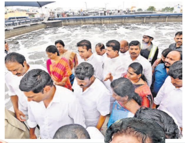
ఫతేనగర్ ఎస్టీసీని పరిశీలిస్తున్న జిల్లా పరిషత్ సభ్యులతో ప్రిసిడెంట్ కేటీఆర్, చిత్రంలో ఎమ్మెల్యేలు సబితా ఇంద్రారెడ్డి, మాగంటి గోపినాథ్, మల్లాది శ్రీనివాస్ రెడ్డి, మాధవరం కృష్ణారావు, తలసాని శ్రీనివాసయ్యాదవ తదితరులు