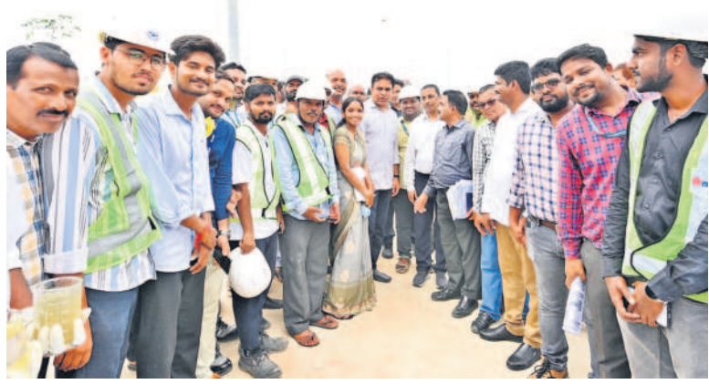
ఫతేనగర్ ఎస్టీసీ సందర్భంలో నిర్మించిన అభివృద్ధి పనులకు పాల్గొని ప్రిసిడెంట్ కేటీఆర్