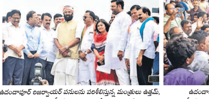
ఉదండాపూర్ రిజర్వేషన్లకు పనులను వరదీనిస్తున్న మంత్రులకు ఉత్తమ, జాబ్లై, ఎంపీ మల్లారెడ్డి, ఎమ్మెల్యేలు, బిన్నారెడ్డి

బీటెక్ రిజర్వేషన్లకు రెండు వ్యాకేషన్లు ఇవ్వాలని డిమాండ్ చేశారు. బీటెక్ రిజర్వేషన్లకు రెండు వ్యాకేషన్లు ఇవ్వాలని డిమాండ్ చేశారు. బీటెక్ రిజర్వేషన్లకు రెండు వ్యాకేషన్లు ఇవ్వాలని డిమాండ్ చేశారు.