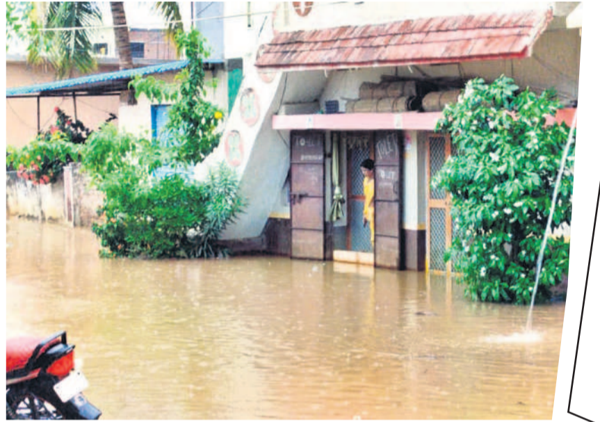
ఎల్లారెడ్డిలో కురిసిన భారీ వర్షంతో ఇండ్లలోకి చేరిన వర్షపు నీరు

బస్టాండ్ సమీపంలో ఉన్న టీవీ కాలనీలోని ఇండ్లలోకి వర్షపు నీరు కేరడంతో ప్రజలు ఇబ్బందులు ఎదుర్కొన్నారు. నీరు వెళ్లడానికి దారి లేకపోవడంతో ఇండ్లలోకి చేరిందని, ఈ విషయంపై ఇప్పటికే పలుమార్లు అధికారులు, ప్రజా ప్రతినిధులకు తెలిపినా పట్టించుకోవడం లేదని వారు ఆవేదన వ్యక్తం చేశారు. లింగంపేట మండలంలోని భవానీపేట గ్రామంలో ఈడుగు గాలులతో కూడిన వర్షం కురిసింది. వర్షం వలన నేలకొరిగింది. ఆరుగాలం కట్టపడి పండించిన పంట చేతికి వచ్చే సమయంలో ఈడుగు గాలులతో కూడిన వర్షం కురియడంతో దిగుబడి తగ్గుతుందని రైతులు ఆవేదన వ్యక్తం చేస్తున్నారు. పంటను వ్యవసాయ శాఖ అధికారులు పరిశీలించి పరిహారం అందేలా చర్యలు తీసుకోవాలని కోరారు.