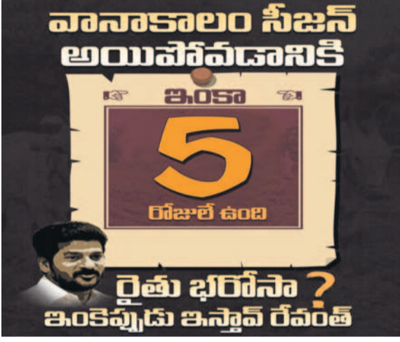
రైతుల వాట్సప్ గ్రూప్ లో వైరల్ అవుతున్న పోస్టు

వరంగల్ డిక్లరేషన్ పేరిట కాంగ్రెస్ రైతులపై పరాల వర్షం కురిపించింది. రైతులందరికీ రూ.2 లక్షల రుణమాఫీ, రైతుభరోసా కింద మరొక ఆగ్రహం వ్యక్తమవుతున్నది. ఇక, బడి సాయం, వడ్డకు క్రియాలకు రూ.500 బోనస్, పంటలకు మద్దతు ధర కల్పిస్తామని హామీ ఇచ్చింది. కానీ అమలులోకి వచ్చేసరికి మాత్రం అనేక షరతులతో రైతాంగాన్ని నిలువనా దగా చేసింది. రూ.2 లక్షల రుణమాఫీ పథకంలో అనేక అంక్షలు విధించడంతో చాలా పథకంలో అనేక అంక్షలు విధించడంతో చాలా మంది రైతులకు ప్రయోజనం దక్కకుండా పోయింది. దీనిపై ఇప్పటికే ఆగ్రహంగా ఉన్న రైతులు సర్కారుపై పోరు ప్రారంభించారు.