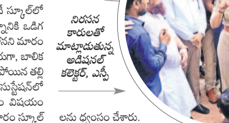
నిదనన కారులతో మాట్లాడుతున్న అడిషనల్ కలెక్టర్, ఎస్సీ