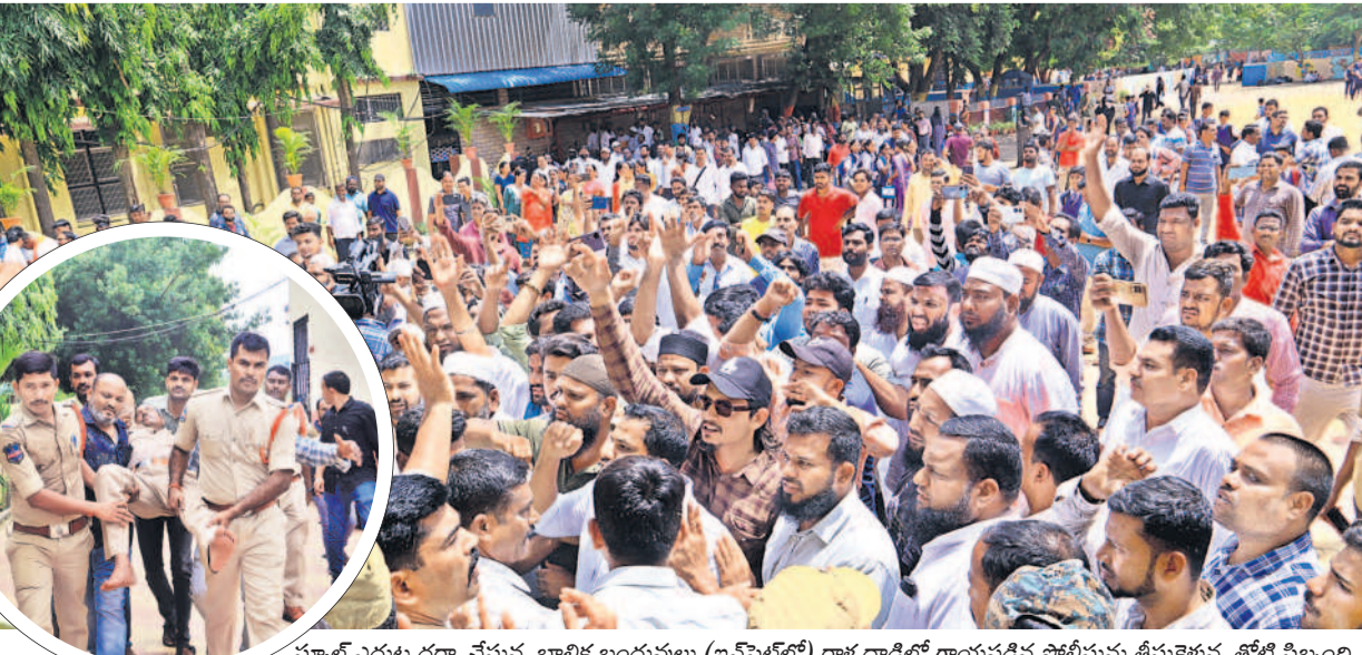
సూర్యోత్పత్తి ఎదుట ధర్మా చేస్తున్న బాలిక బంధువులు (ఇన్సెల్లో) రాళ్ల దాడిలో గాయపడిన పోలీసును తీసుకెళ్లడం తోటి సిబ్బంది