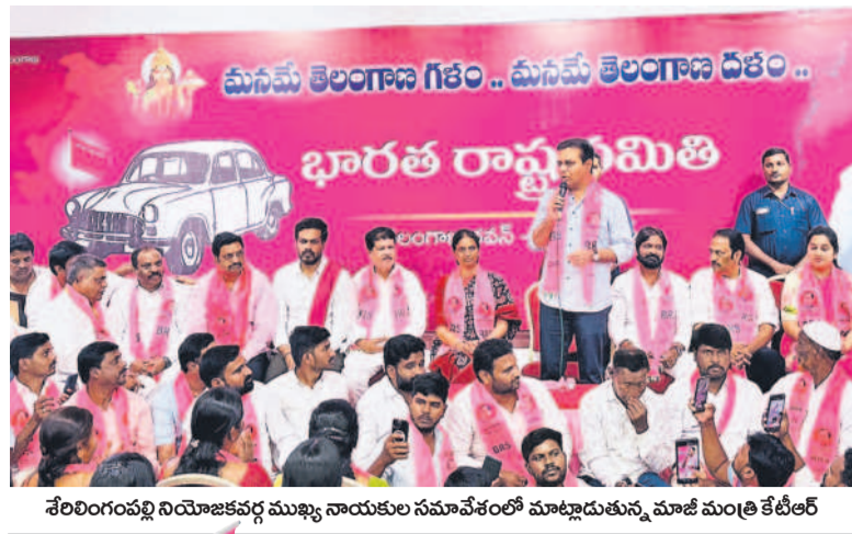
శేరిలింగంపల్లి నియోజకవర్గ ముఖ్య నాయకుల సమావేశంలో మాట్లాడుతున్న మాజీ మంత్రి కేటీఆర్