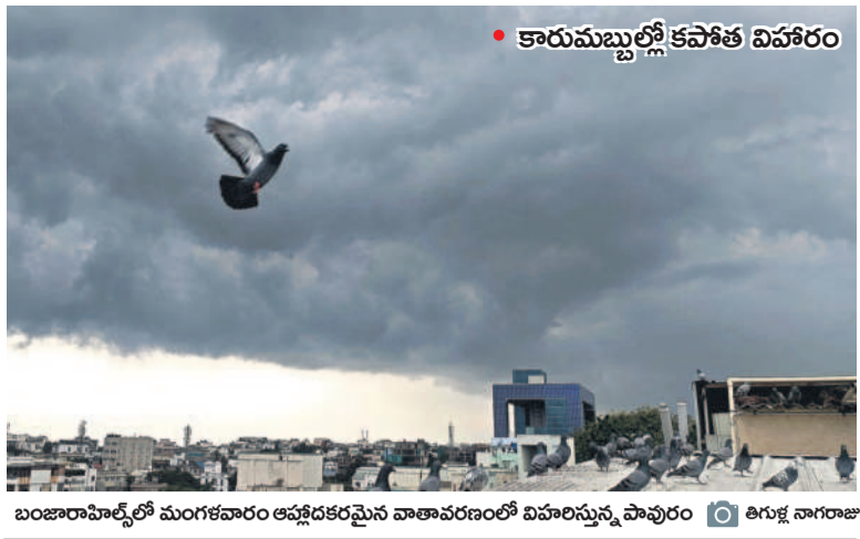
కారుమబ్బుల్లో కపాత విహారం