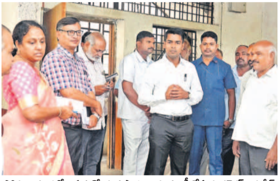
సోమజిగూడలోని ప్రభుత్వంలోని పాఠశాలను తనిఖీ చేస్తున్న కలెక్టర్ అనుదీప్

ప్రభుత్వంలోని పాఠశాలలో కలెక్టర్ తనిఖీ సీటీఆర్, సెప్టెంబరు 24 (నమస్తే తెలంగాణ): ఖైరతాబాద్లోని సోమా జిగూడలో ఎంఎస్ ప్రభుత్వంలోని పాఠశాలను కలెక్టర్ అనుదీప్ దురిశిక్షిస్తున్నారని మంగళవారం ఆరోగ్యశాఖలో తనిఖీ చేశారు. కాగా, కమ్యూనిటీ హాల్లో నిర్వహించే కార్యక్రమాల వల్ల పాఠశాలలో విద్యార్థులకు ఇబ్బందికరంగా మారుతుందని పలువురు స్థానికులు కలెక్టర్ దృష్టికి తీసుకొచ్చారు. సమస్యను పరిష్కరిస్తామని కలెక్టర్ వారికి హామీ ఇచ్చారు. కార్యక్రమంలో డి.ఈ.ఆ. రోహిణి తదితరులు పాల్గొన్నారు.