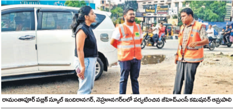
రామంతాపూర్ పబ్లిక్ స్కూల్ ఇందిరానగర్, సర్వానగర్లో పర్యటించిన జిహెచ్ఎంసీ కమిషనర్ ఆప్రమోది