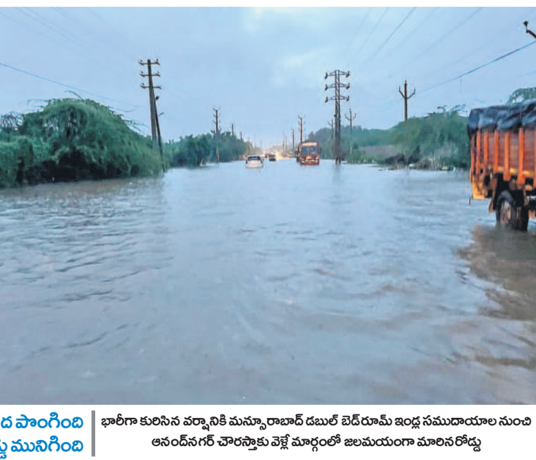
పరద పొంగింది రోడ్డు ముగింది

క్షేత్రస్థాయి పర్యటనలో కమిషనర్ ఆప్రమోది కాట సీటీఆర్, సెప్టెంబరు 24 (నమస్తే తెలంగాణ): నగరంలో మూడు రోజులుగా కురుస్తున్న వర్షాల నేపథ్యంలో అంటు వ్యాధులు ప్రబల అవకాశం ఉన్నందున పాలిశుద్ధ్య కార్యక్రమాల సజావుగా జరిగేలా చర్యలు చేపట్టాలని జిహెచ్ఎంసీ కమిషనర్ ఆప్రమోది కాట అధికారులను ఆదేశించారు. కమిషనర్ ఆప్రమోది ఎల్సీనగర్ జోన్లోని పలు ప్రాంతాల్లో మంగళవారం ఆరోగ్యశాఖ పర్యటించి శానిటేషన్ నిర్వహణ, రోడ్లపై పాల్వోర్స్, రోడ్ల స్థితి గతులను పరిశీలించారు. సరూరనగర్ నుంచి ఎల్సీనగర్, నాగల్ మీదుగా ఉప్పల్ భూయత్, ఉప్పల్ సన్నాపాలం చేస్తున్నట్లుగా తెలిసింది. ఈ క్రమంలో ఎంతో పక్కస్థానాలు చెరువులకు నిర్మాణం చేయాలని హెచ్చరించారు. ప్రధానంగా బేగంపేట, బంజారాహిల్స్, ఐటీ కారిడార్ తదితర ప్రాంతాల్లో వాహనాలు కిలో మీటర్ల మేర నిలిచిపోయాయి.