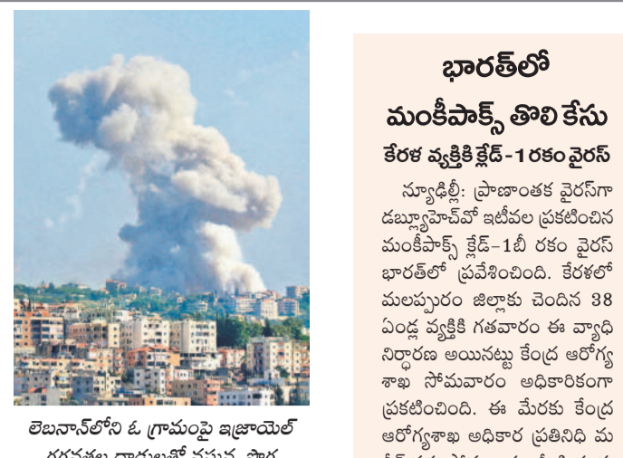
లెబనాన్ లోని ఓ గ్రామంపై ఇజ్రాయెల్ గగనచక్ర దాడులతో వచ్చిన పొగ

జెరూసలేం: హెబ్రెయ్లా ఉగ్రవాదులకు ఇజ్రాయెల్ సైన్యం చుక్కలు చూపిస్తుంది. 2006 తర్వాత అత్యంత భీకరంగా సోమ వారం దాడుల్లో 300 లక్షల వ్యయం దాడులు జరిపింది. ఇందులో 274 మంది మరణించగా, సుమారు 1,000 మంది గాయపడ్డారు. హెబ్రెయ్లాపై గగనచక్రం నుంచి విరుచుకుపడతామని, ఇజ్రాయిల్ చేసే ప్రతిదాడునా దక్షిణ, తూర్పు లెబనాన్ ప్రజలకు ఇజ్రాయెల్ సైన్యం హెబ్రెయ్లాపై దాడులు జరపబడవచ్చని హెబ్రెయ్లా తెలిపింది. ఇజ్రాయెల్ చర్యలు సమాఖ్య నాశనం కోసం యుద్ధంతో సమానమని లెబనాన్ ప్రధాన మంత్రి అరోబిందాడు. హమాస్ బీఫ్ మృతి? అక్టోబర్ 7 నాటి దాడుల రూపకర్త, హమాస్ అధినేత యూసుఫ్ సిన్హార్ మృతి చెందినట్లు ఇజ్రాయెల్ దళాలు అనుమానిస్తున్నాయి. సుదీర్ఘ కాలంగా అతడి కవచం కల లెకడోవాలి అనే భావిస్తున్నాయి. ఈ మేరకు అంతర్జాతీయ మీడియాలో వార్తలు వెలువడ్డాయి.