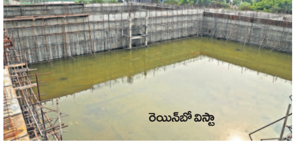
రెయిన్ బో విస్కా