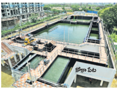
అందుబాటులోకి వచ్చిన ఎస్టీపీలు...