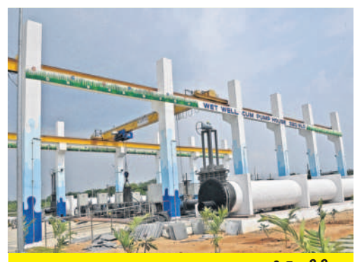
అధికారికంగా ప్రారంభించాల్సిన నాగోల్ ఎస్టీపీ