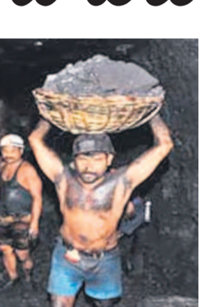
హయాంలో రూ.2,780 కోట్లు కార్మికులకు అందించారు.