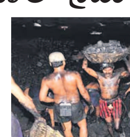
హయాంలో రూ.2,780 కోట్లు కార్మికులకు అందించారు.

ఇక కేంద్ర బీజేపీ ప్రభుత్వం కార్మికుల పట్ల, సంస్థ పట్ల ఎలా వ్యవహరిస్తుందో కొత్తగా చెప్పాల్సిన అవసరం లేదు. సింగరేణి సంస్థ మునుగదనే బోగ్స్ తప్పకపై అధికారపడి ఉంటుందన్న అందరికీ విషయం. అలాంటి సంస్థ అధిపతి వెంచులంటే ఎప్పటికప్పుడు కొత్త బోగ్స్ బ్రాజ్ లను కేంద్రం కేటాయిం చాల్చి ఉంటుంది. అలాంటి లాభాల్లో ఉన్న సింగరేణి సంస్థ కొత్త బోగ్స్ బ్రాజ్ లను కేటాయిం చాల్చి ఉంటుంది. అయినప్పటికీ సింగరేణి వెంచులంటే ఎప్పటికప్పుడు కొత్త బోగ్స్ బ్రాజ్ లను కేటాయిం చాల్చి ఉంటుంది. అయినప్పటికీ సింగరేణి వెంచులంటే ఎప్పటికప్పుడు కొత్త బోగ్స్ బ్రాజ్ లను కేటాయిం చాల్చి ఉంటుంది.