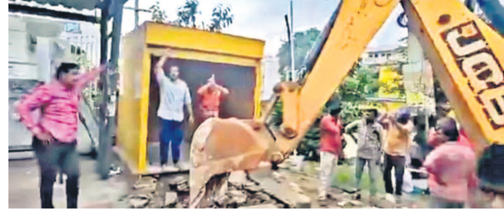
'మా బతుకును నాశనం చేస్తున్నది. కేసీఆర్ సారూ.. ఈ అన్యాయాన్ని మాడు. మమ్మల్ని మీరే కాపాడాలి' అంటూ తల్లి కొడుకు వేడుకుంటున్న వీడియో సామాజిక మాధ్యమాల్లో అందరినీ కబళించింది. కాప్రా మున్సిపాలిటీలో సోమవారం అధికారులు పలు నిర్మాణాలను, దుకాణాలను మూతపెట్టారు. తమ చెప్పుల దుకాణాన్ని కూల్చవద్దంటూ ఓ తల్లికొడుకు అధికారుల కాళ్ళపై పడ్డారు.