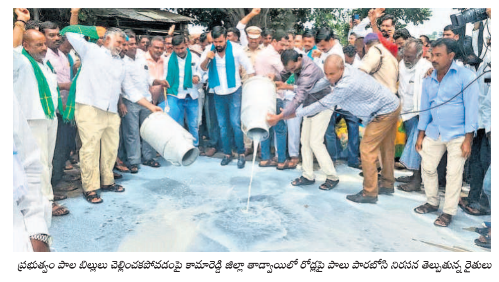
ప్రభుత్వం పాల బిల్లులు చెల్లించకపోవడంపై కామారెడ్డి జిల్లా తాడ్యాంట్లో రోడ్లపై పాల పారబోసే నిరసన తెల్పుతున్న రైతులు