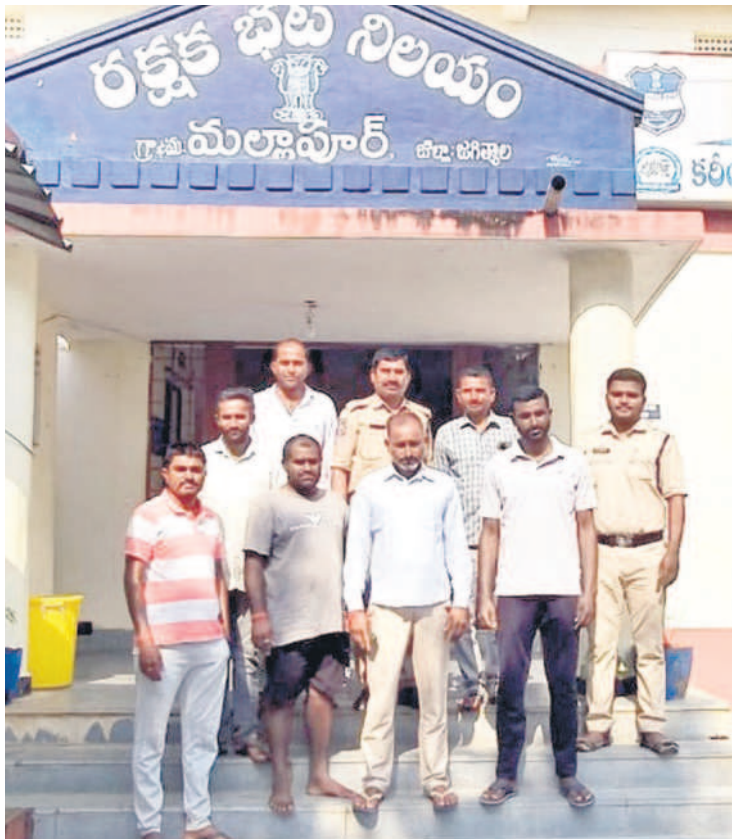
మల్లాపూర్లో పోలీస్ స్టేషన్లో ఎదుట రైతు సంఘాల నాయకులు

రైతులకు మద్దతిచ్చిన టీఆర్ఎస్ నేతలు ప్రజా భవన్ ముట్టడికి తరలివెళ్లారని ముందు అర్థంపై సర్కారుపై ఆగ్రహించిన నాయకులు