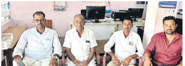
దుర్రంగి పోలీస్ స్టేషన్లో టీఆర్ఎస్ నాయకులు

ప్రజా ఉద్యమంపై నిరంధంబ మోపుతున్నారు. రైతులకు మద్దతిచ్చిన టీఆర్ఎస్ నాయకులను ముందస్తుగా అరెస్టు చేశారు. రుణమాఫీ కాని రైతుల పిలుపు మేరకు 'ఫలో ప్రజా భవన్' ధర్నాకు వెళ్లకుండా నేతలను గురువారం ఉదయమే అదుపు లోకి తీసుకుని, స్టేషన్లకు తరలించారు. ఉమ్మడి కరీంనగర్ జిల్లా సుందరి తరలి వెళ్తున్న వారిని ఎక్కడిక్కడ అదుకోవడంతో టీఆర్ఎస్ నాయకులు ఆగ్రహం వ్యక్తం చేశారు. ఇలాంటి అక్రమ అరెస్టులకు రైతుల ఉద్యమంను ఆపలేదని, రైతుల సమస్యలను పరిష్కారం అయ్యేంత వరకు ఉద్యమిస్తామని హెచ్చరించారు.