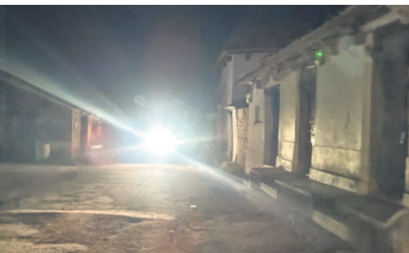
కోనరావుపేటలో రాత్రి పూట కరెంటు లేక అంధకారంలో ఓ వీధి