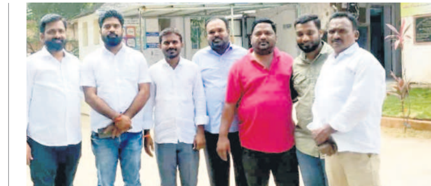
మేములవాడ పోలీస్ స్టేషన్లో టీఆర్ఎస్ నాయకులు

5 కరీంనగర్, శుక్రవారం 20 సెప్టెంబర్ 2024 PEDDAPALLI