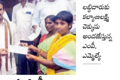
మరిపెడ : లబ్ధిదారులకు కల్యాణలక్ష్మి చెక్కులను అందజేస్తున్న ఎంపీ, ఎమ్మెల్యే

మరిపెడ/దంతాలపల్లి, సెప్టెంబర్ 19 : మరిపెడ మున్సిపల్ కేంద్రం, దంతాలపల్లి మండల కేంద్రంలోని రైతు వేదికలో గురువారం ఎంపీ బలరాంనాయక్, డోక్టర్ల ఎమ్మెల్యే రాంబండ్రానాయక్ కల్యాణలక్ష్మి, షాద్ ముబారక్ లబ్ధిదారులకు చెక్కులను పంపిణీ చేశారు. చిన్నగూడెం రుకు చెందిన 21 మంది, మరిపెడకు చెందిన 160మంది, దంతాలపల్లికి చెందిన 80 మందికి చెక్కులకు అందజేశారు. ఈ సందర్భంగా వారు కల్యాణ లక్ష్మి పద్ధతి పేరిట అడవిల్లలకు వరదన్నారు.