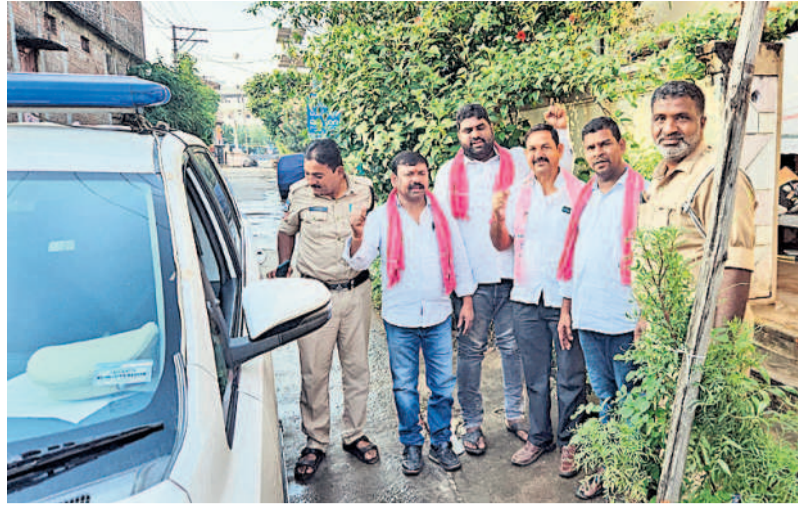
రాజన్న నిలసిల్ల జిల్లా తంగళ్లపల్లి మండల కేంద్రంలో బీఆర్ఎస్ నేతలను అరెస్టు చేసి రాజాజు తీసుకెళ్తున్న పోలీసులు