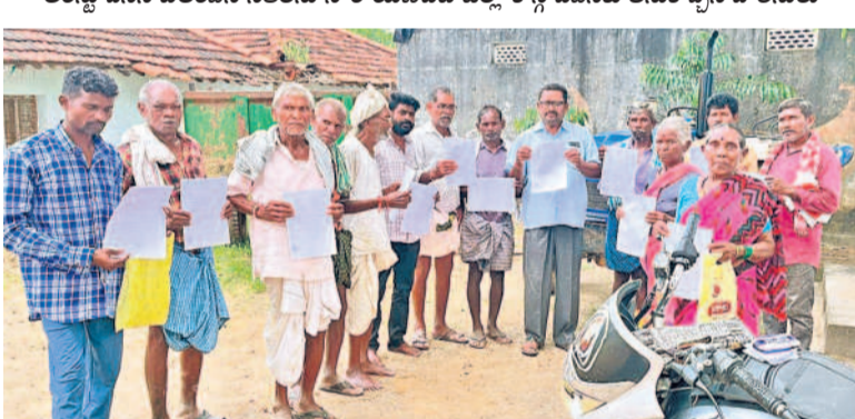
కాంగ్రెస్ ప్రభుత్వం రైతులకు పూర్తిస్థాయిలో రూ.2 లక్షల రుణమాఫీ చేసేలా చూడాలని గవర్నర్ జిమ్మెద్దే వర్కకు గురువారం రెండో రోజూ అన్నదాతలు ఉత్సాహం రాశారు. మంబిల్లూ జిల్లా నెల్లూ మండల కేంద్రంపాటు మైలారం, అవుడం పోస్టాఫీసులో దాదాపు 100 మంది రైతులు గవర్నర్ కు ఉత్సాహం పోస్తూ చేశారు. కొండం రైతులు లిజిల్లో పోస్తూ చేయగా.. మలకొండం సాధారణ పోస్తూ చేశారు.