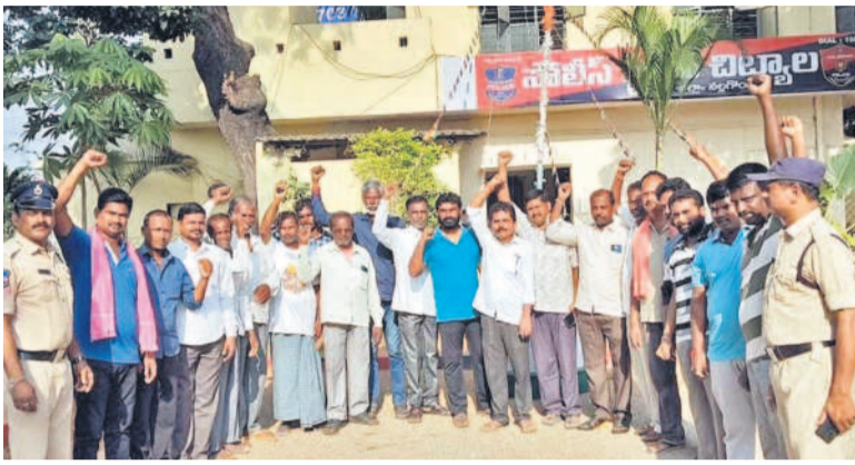
నల్లగొండ జిల్లా బిట్టూరు పోలీస్ స్టేషన్లో నినాదాలు చేస్తున్న బీఆర్ఎస్ నాయకులు