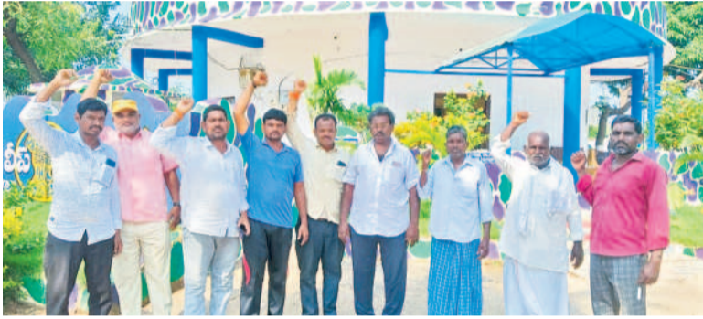
ములుగు జిల్లా గోవిందరావుపేట మండలం వద్ద పోలీస్ స్టేషన్లో నినాదాలు చేస్తున్న రైతులు