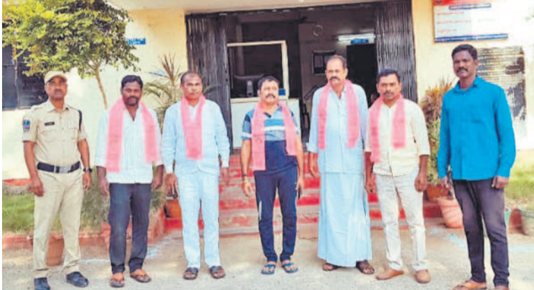
అరెస్టు చేసిన బీఆర్ఎస్ నేతలను నారాయణపేట జిల్లా కోర్టు మీడిన్ కు తీసుకొచ్చిన పోలీసులు