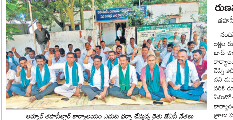
ఆర్కాడ్ తహసీల్దార్ కార్యాలయం ఎదుట దర్శా చేస్తున్న రైతు జేఏసీ నేతలు

దివాలా తీసేందంటూ సీఎం, మంత్రులు ఎదురుగాట్టు మాటలతో తప్పుడు ప్రచారం చేస్తున్నారని ఆక్షేపించారు. ఇక్కడ అలాంటి చేతగాని మాటలను ఆపాలని సూచించారు. కాంగ్రెస్ ప్రభుత్వం పది నెలల పాటులో ఒక్క పాలసీగాని, కొత్త పథకం గాని అమలు చేయలేదని, అయ్యారూ. 75 వేల కోట్ల అప్పు చేశారని విమర్శించారు. 2014-15లో తెలంగాణ తలసరి ఆదాయం రూ. 1.24 లక్షలు ఉన్నదని, 2023-24 నాటికి రూ. 3.47 లక్షలకు చేరిందని చెప్పారు. దేశ తలసరి ఆదాయం కేవలం రూ. 1.83 లక్షలేదని గుర్తుచేశారు. వృద్ధి రేటులో దేశం కంటే తెలంగాణ 19.9 శాతం ముందున్నదని తెలిపారు. జీడిపీల్లో తెలంగాణ వాటా 3.8 శాతం ఉండగా 2023-24 నాటికి 4.9 శాతానికి చేరిందని, 2014-15లో తెలంగాణ జీఎన్ డీపీ రూ. 5.05 లక్షల కోట్లు ఉండగా 2023-24 నాటికి 14.62 లక్షల కోట్లకు చేరిందని వివరించారు. బజెట్లో ఉద్యోగం సంఖ్య, ఎగుమతులు భారీగా పెరిగాయని, వీటికి ప్రధాన కారణం కేసీఆర్ అని స్పష్టం చేశారు.