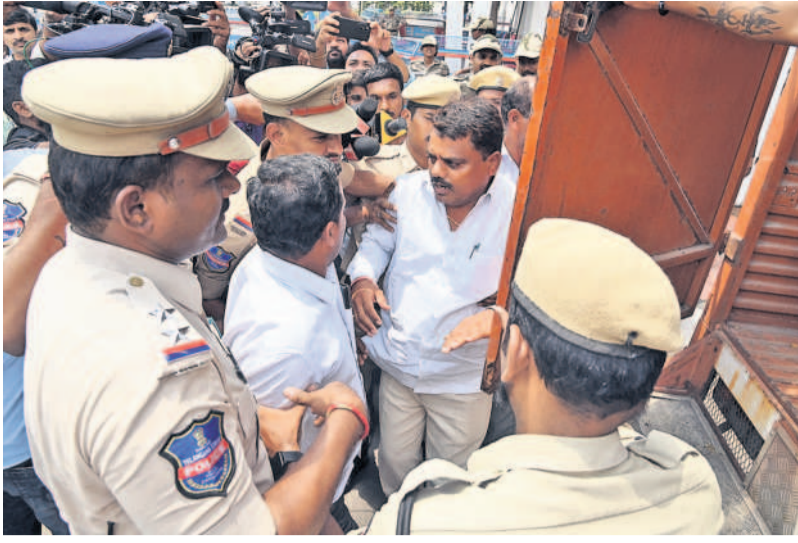
గురువారం ప్రజాభవన్ వద్ద దర్శా చేసేందుకు వచ్చిన రైతులను అరెస్టు చేస్తున్న పోలీసులు