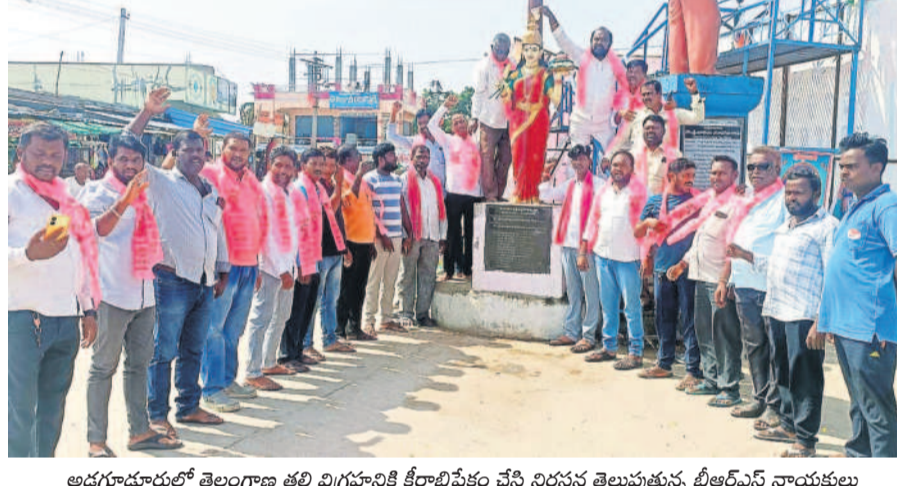
అడ్లగూడూరులో తెలంగాణ తల్లి విగ్రహానికి క్షీరాభిషేకం చేసి నిరసన తెలుపుతున్న బీఆర్ఎస్ నాయకులు