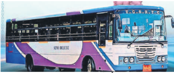
నల్లగొండ డిపోకు వచ్చిన సెమీ డీలక్స్ బస్సు