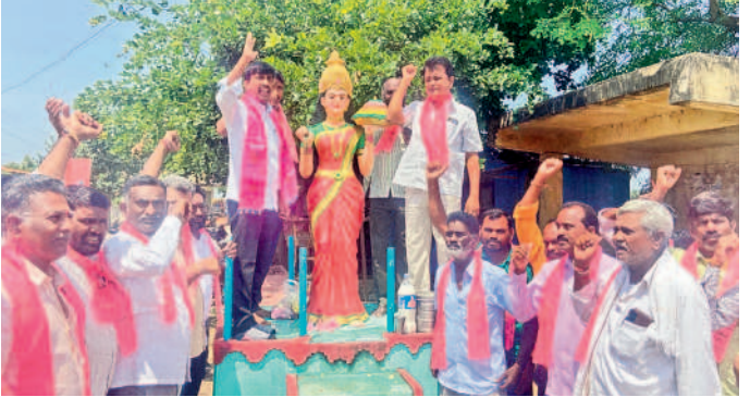
పాలకూరు: దర్శనాల్లో తెలంగాణ తల్లి విగ్రహానికి పాలాభిషేకం చేస్తున్న గులాబీ శ్రేణులు