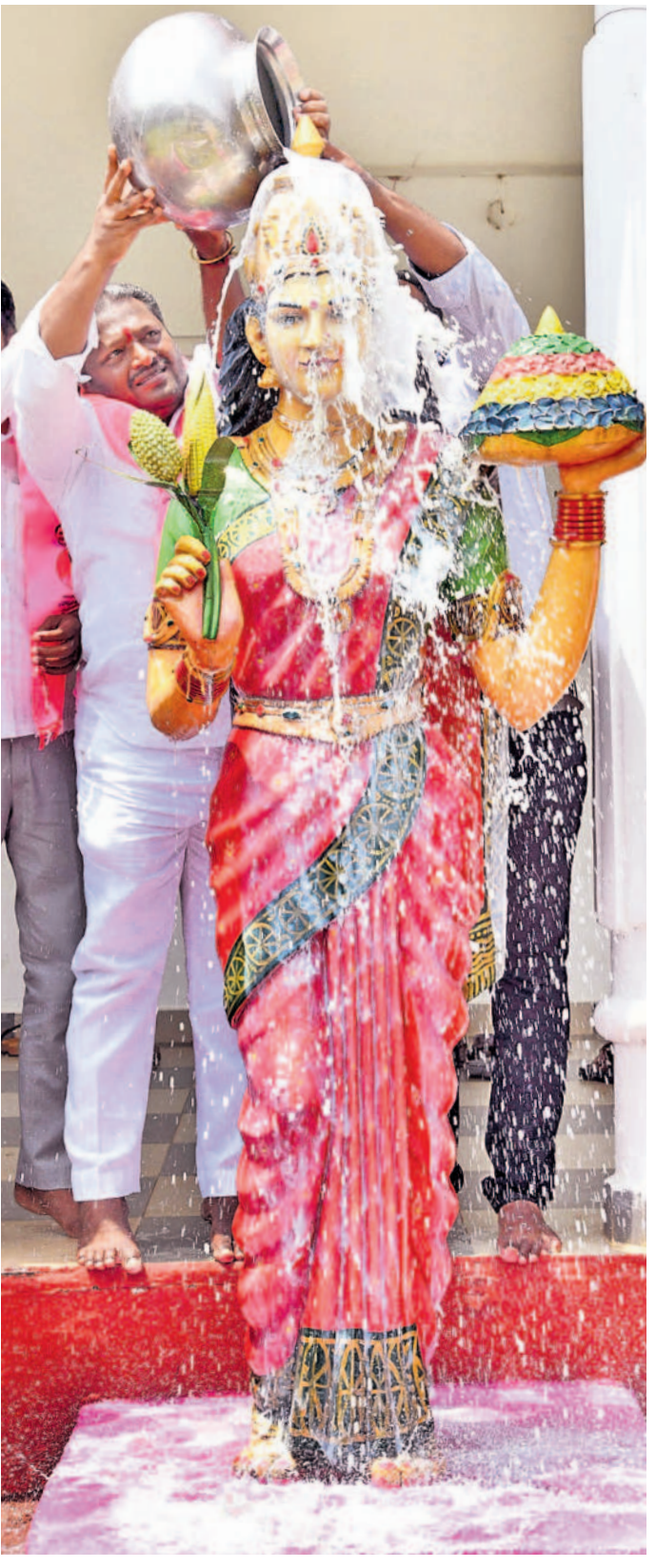
హనుమకొండ బీఆర్ఎస్ కార్యాలయంలో తెలంగాణ తల్లికి పాలాభిషేకం చేస్తున్న బీఆర్ఎస్ నేత పులి రజనీకాంత్

5 వరంగల్, బుధవారం 18 సెప్టెంబర్ 2024 WARANGAL