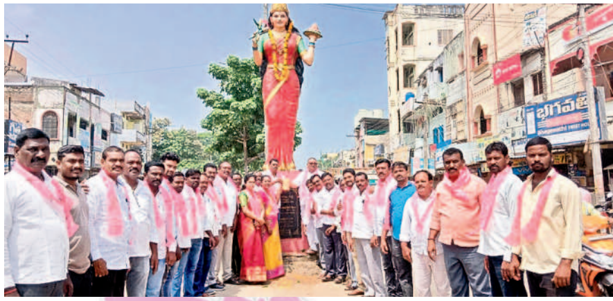
నర్సంపేటలో తెలంగాణ తల్లి విగ్రహం ఎదుట నిరసన తెలుపుతున్న బీఆర్ఎస్ నాయకులు