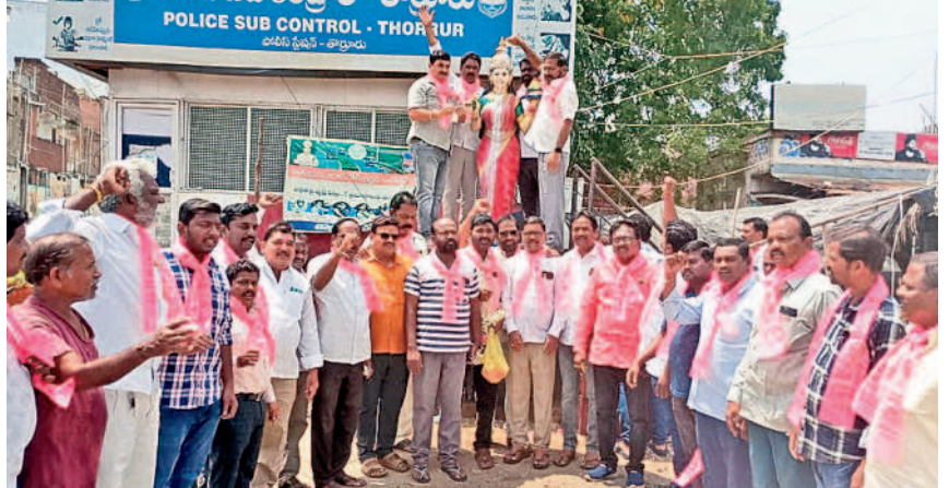
తొర్రూరు అల్లసీని బస్టాండ్ ఎదుట ఉన్న తెలంగాణ తల్లి విగ్రహానికి పాలాభిషేకం చేస్తున్న బీఆర్ఎస్ నాయకులు