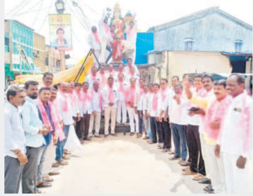
భిక్షువారులో తెలంగాణ తల్లి విగ్రహాలను క్షీరాభిషేకం చేస్తున్న బీఆర్ఎస్ నాయకులు