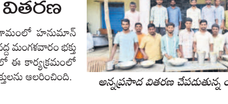
అన్నప్రసాద వితరణ చేపట్టే యువకులు

నాగిరెడ్డిపేట, సెప్టెంబర్ 17: మండలంలోని చీనూర్ గ్రామంలో హనుమాన్ యాత్ర అధ్వర్యంలో ఏర్పాటు చేసిన వినాయక మండపం వద్ద మంగళవారం భక్తులకు అన్నప్రసాద వితరణ చేపట్టారు. భక్తులు పెద్దసంఖ్యలో ఈ కార్యక్రమంలో పాల్గొన్నారు. మండపం వద్ద రాత్రి నిర్వహించిన భజన భక్తులను అలరించింది.