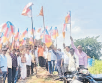
ఎల్లారెడ్డిలో జెండాను అవిష్కరిస్తున్న విశ్వకర్మ కులస్తులు