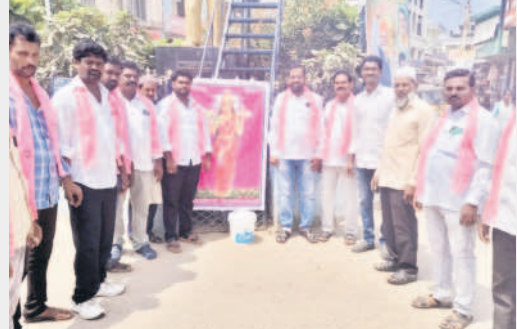
బాన్సువాడలోని అంబేద్కర్ చౌరస్తాలో తెలంగాణ తల్లి చిత్రపటాలను క్షీరాభిషేకం చేస్తున్న బీఆర్ఎస్ నాయకులు