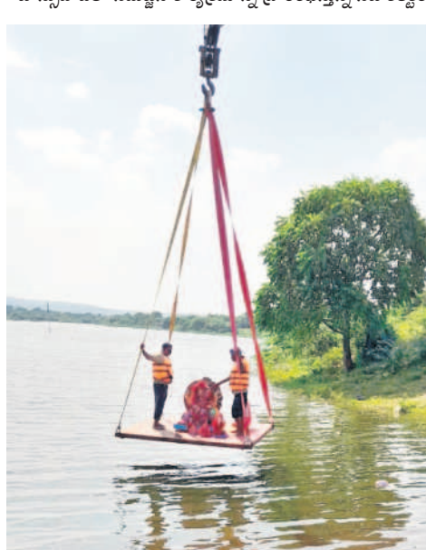
మద్దూర్ మైసమ్మ చెరువులో క్రీమి సహాయంతో గణేశుడి విగ్రహాన్ని నిమజ్జనం చేస్తున్న భక్తులు