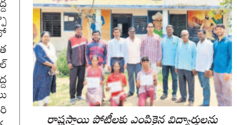
రాష్ట్రస్థాయి పోటీలకు ఎంపికైన విద్యార్థులకు అభినందిస్తున్న ఉపాధ్యాయులు