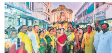
బాన్సువాడలో నిమజ్జన కార్యక్రమాన్ని ప్రారంభిస్తున్న సబ్ కలెక్టర్