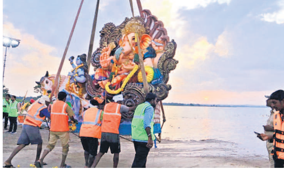
కామారెడ్డి మున్సిపల్ పరిషత్లోని బీబీపేట్ చెరువులో వినాయకుడి నిమజ్జనం