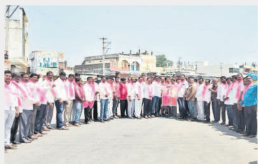
మాచారెడ్డిలో తెలంగాణ తల్లి చిత్రపటాలను క్షీరాభిషేకం చేస్తున్న బీఆర్ఎస్ నాయకులు