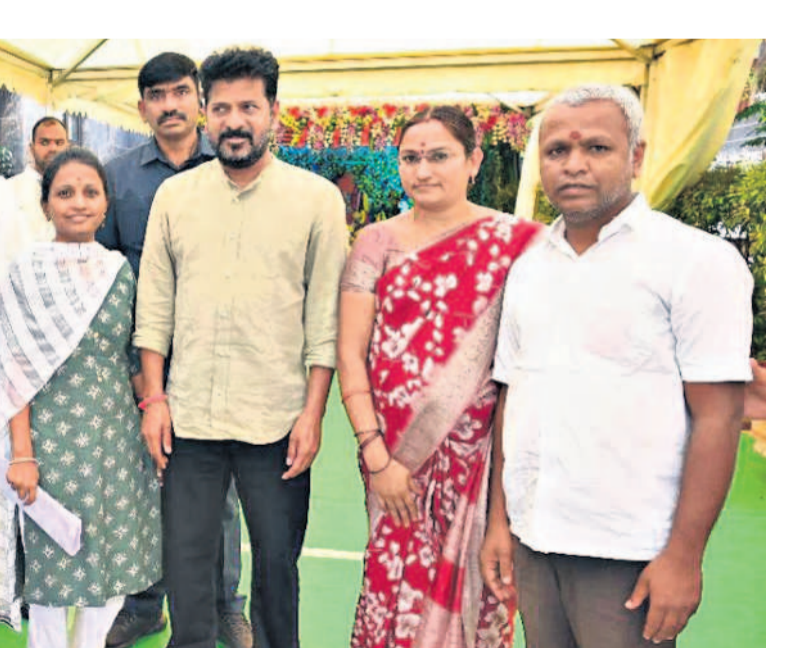
సింఠి రేవంత్ రెడ్డిని కలిసిన 2008 డిఎస్సీ అభ్యర్థులు

గణనాథుడి శోభాయాత్రకు భారీగా భక్తులు హాజరుకానున్నారు. ఈ నేపథ్యంలో కొన్ని జాగ్రత్తలు తీసుకుంటే.. ఎలాంటి ఇబ్బందులు తలెత్తవని నిపుణులు అంటున్నారు. బిన్యా.. పెద్ద అందరూ నిమజ్జనానికి తరలివెళ్లారు. అయితే పిల్లల విషయంలో తల్లిదండ్రులు జాగ్రత్తగా ఉండాలంటున్నారు. ఏ మాత్రం ఏమరు పాటుగా ఉండకూడదు.. వారిని నిరంతరం కంట కనిపెడుతూ.. ఉండాలని, లేదంటే వారు జనంలో తప్పిపోయే ప్రమాదం ఉంటుందని వెబుతున్నారు. అలాగే నిమజ్జనం తరలింపే వాహనాలపై పరిమితికి మించి భక్తులు ఎక్కిన చదం మంచిది కాదని సూచిస్తున్నారు. నిమజ్జన యాత్రలో డ్యూస్సులు, సంగీతం శృతి మించకుండా ఉండాలని నిర్వాహకులు హుసుకోవాలంటున్నారు. ముఖ్యంగా విద్యార్థి తీగలతో మరింత అప్రమత్తంగా ఉండాలంటున్నారు.