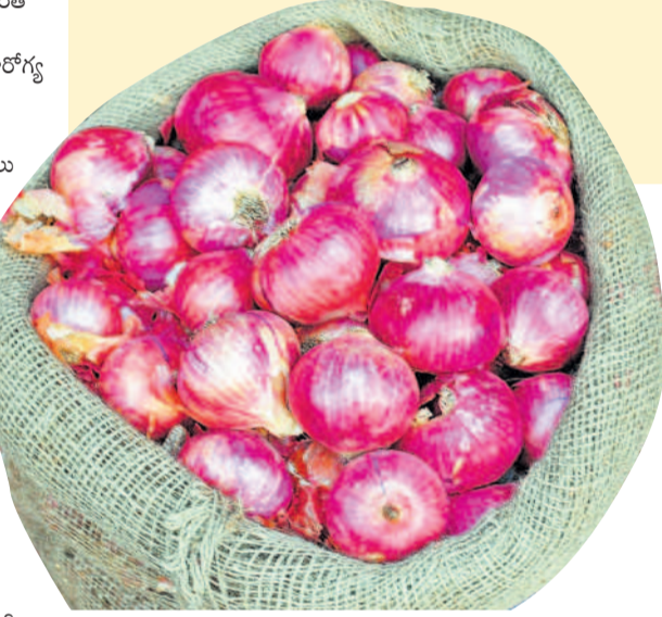
విక్రయాల్పై చర్చించాలి. వ్యాపారులు కృత్రిమ కొరత సృష్టించి తగు చర్యలు తీసుకోవాలి. కానీ.. ఇది పక్కాగా అమలుకావడం లేదు. దీంతో గత కొంతకాలంగా ధరలు పెరుగుతూనే ఉన్నాయి.