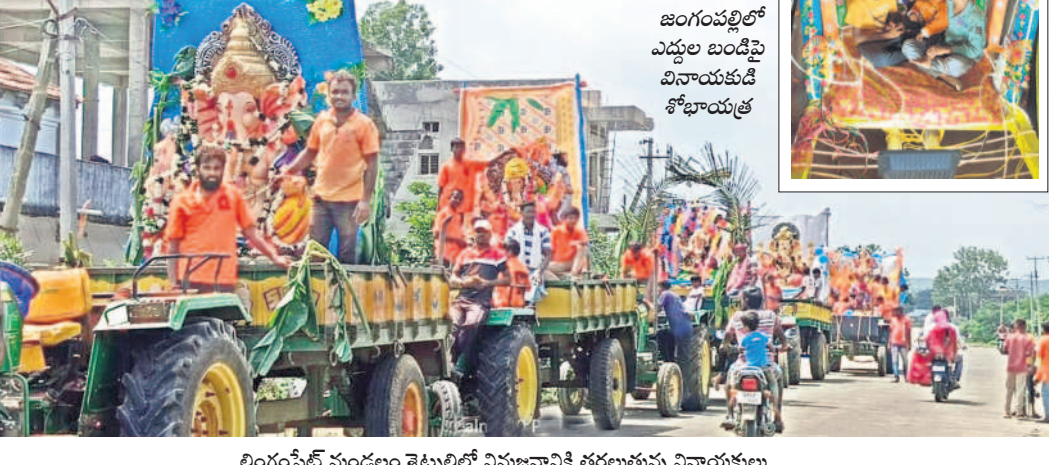
లింగంపేట్ మండలం శెట్టిల్లిలో నిమజ్జనానికి తరలనున్న వినాయకులు