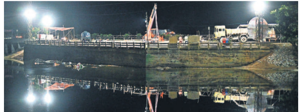
నల్లగొండ జిల్లాకేంద్రంలోని వల్లభరావు చెరువు వద్ద నిమజ్జనానికి చేసిన ఏర్పాట్లు

నల్లగొండ జిల్లాలో నల్లగొండ జిల్లా కేంద్రంలో గణేశ నిమజ్జనోత్సవానికి ఉత్సవ కమిటీతోపాటు అధికార యంత్రాంగం సర్వం సిద్ధం చేశాయి. నిమజ్జనం జరిగే పానగల్ బైపాస్ లోని వల్లభరావు చెరువులో 9 ఫీట్ల కంటే తక్కువ ఉన్న విగ్రహాలు, సాగర్ 14వ మైలురాయి వద్ద 9 ఫీట్ల కంటే పెద్ద విగ్రహాలను తరలించేలా ఏర్పాటు చేశారు. ఇప్పటికే కల్వర్, ఎస్పీలు నిమజ్జనం చేసే ప్రాంతాల్లో పర్యవేక్షించి ఏర్పాటు చేసే పరిశీలించి అధికారులకు పలు