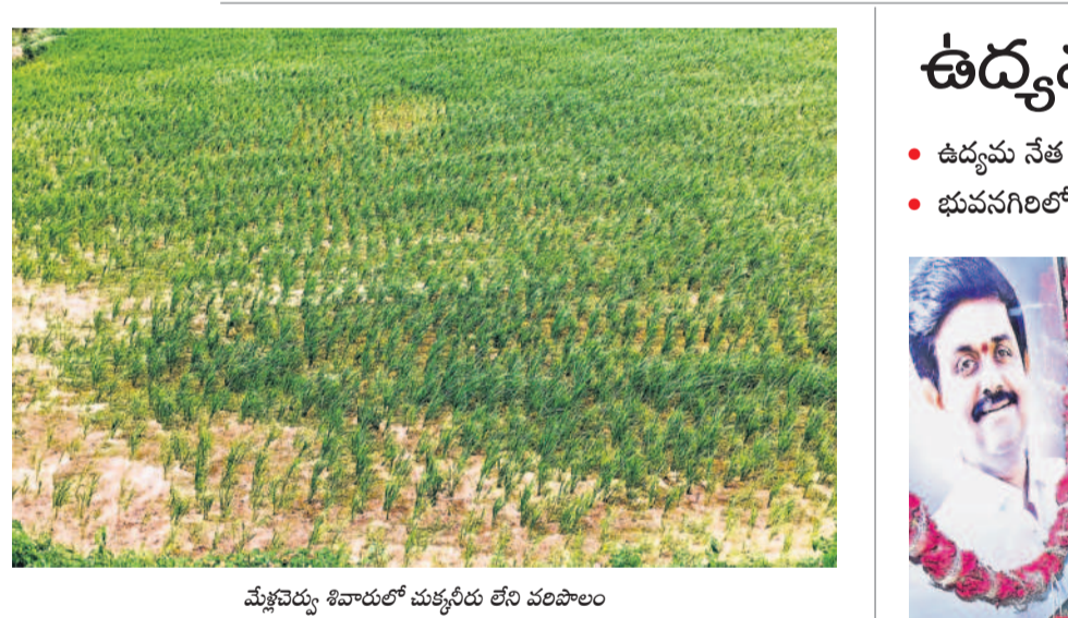
మేకవెట్టు శివారులో మక్కవీరు లోని వరిపొలం

సాగర్ ఆయకట్టులో ఎండుతున్న వరి పొలాలు ఎడమకాల్వ గండిని వెంటనే పూడ్చి నీటిని విడుదల చేయాలంటున్న రైతులు మేకవెట్టు, సెప్టెంబర్ 15 : ఇటీవల భారీ వర్షాలకు నడిగూడెం వద్ద నాగార్జున సాగర్ ఎడమ కాల్వ గండివడడంతో ఈ నెల 1 నుంచి కాల్వలకు నీటి విడుదలను నిలుపుదల చేశారు. దాంతో ఆయకట్టు కింద సాగు చేసిన వరిపొలాలు నీరులేక ఎండిపోతున్నాయి. మరో రెండు రోజులు ఇదే పరిస్థితి ఉంటే తీవ్రంగా నష్టపోతామని రైతులు అందోళన వ్యక్తం చేస్తున్నారు. మరోవైపు నీరందక కొంత మంది రైతులు ఇంకా వరినాట్లు వేయలేదు. గండిని వెంటనే పూడ్చి సాగర్ నీటిని విడుదల చేసి, పంటలను కాపాడాలని రైతులు ప్రభుత్వాన్ని కోరుతున్నారు.