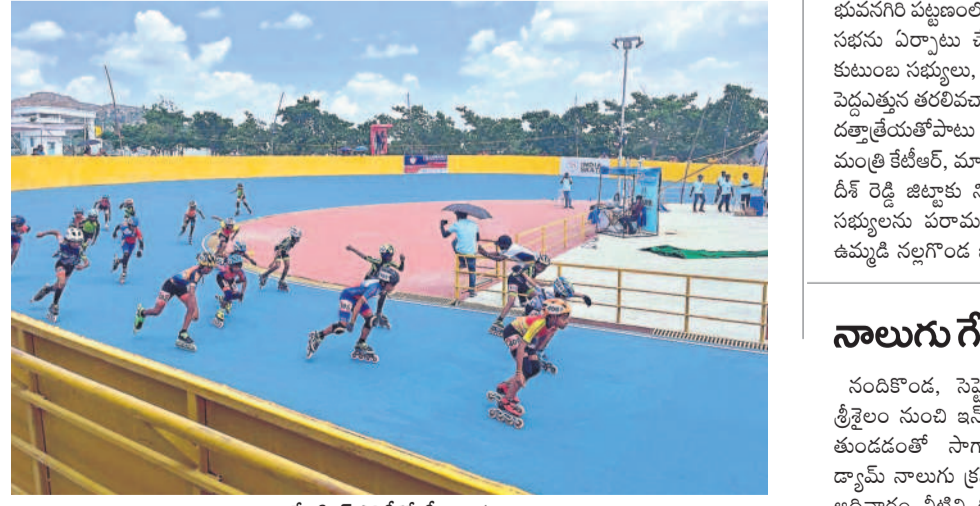
స్కేటింగ్ పోటీల్లో క్రీడాకారులు

సాగర్ ఆయకట్టులో ఎండుతున్న వరి పొలాలు ఎడమకాల్వ గండిని వెంటనే పూడ్చి నీటిని విడుదల చేయాలంటున్న రైతులు మేకవెట్టు, సెప్టెంబర్ 15 : ఇటీవల భారీ వర్షాలకు నడిగూడెం వద్ద నాగార్జున సాగర్ ఎడమ కాల్వ గండివడడంతో ఈ నెల 1 నుంచి కాల్వలకు నీటి విడుదలను నిలుపుదల చేశారు. దాంతో ఆయకట్టు కింద సాగు చేసిన వరిపొలాలు నీరులేక ఎండిపోతున్నాయి. మరో రెండు రోజులు ఇదే పరిస్థితి ఉంటే తీవ్రంగా నష్టపోతామని రైతులు అందోళన వ్యక్తం చేస్తున్నారు. మరోవైపు నీరందక కొంత మంది రైతులు ఇంకా వరినాట్లు వేయలేదు. గండిని వెంటనే పూడ్చి సాగర్ నీటిని విడుదల చేసి, పంటలను కాపాడాలని రైతులు ప్రభుత్వాన్ని కోరుతున్నారు.