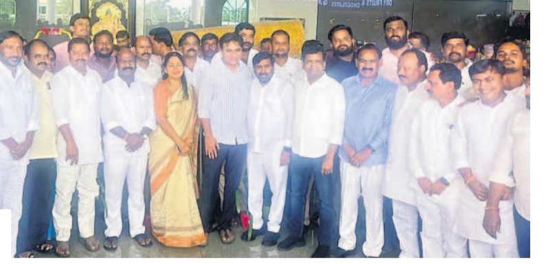
బీఆర్ఎస్ ఉమ్మడి జిల్లా నేతలతో పార్టీ వర్కింగ్ ప్రెసిడెంట్ కేటీఆర్