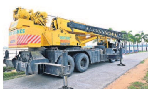
సూర్యాపేటలో విగ్రహాల ఎత్తడానికి సిద్ధంగా ఉన్న భారీ శ్రేణులు

రామగిరి/బొంబాయిబజార్, సెప్టెంబర్ 15 : తొమ్మిది రోజులపాటు విశేష పూజల దుకున్న గణపతుడు నేడు నిమజ్జనానికి తరలివెళ్తున్నాడు. ఉమ్మడి జిల్లా వ్యాప్తంగా వినాయకుడి శోభయాత్రతో పాటు నిమజ్జనానికి అధికార యంత్రాంగం ఆన్ని ఏర్పాటు పూర్తి చేసింది. చెరువులు, కాల్వల వద్ద భారీ శ్రేణులు, గత ఈతగాళ్లను సిద్ధం చేసింది. నిరంతరం పర్యవేక్షించేలా పోలీసు బందోబస్తును కేటాయించింది. సోమవారం ఉదయం నుంచి రాత్రి వరకు వినాయక నిమజ్జనోత్సవం కోలాహలంగా కొనసాగుతున్నది.