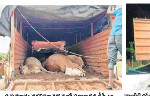
పశువులను తరలిస్తూ రైల్వేలో పట్టుబడడం దీనిని

కుటుంబం ఆసిఫాబాద్, సెప్టెంబర్ 15 (సమస్త తెలంగాణ) : జిల్లా నుంచి పశువుల అక్రమ రవాణా జోరుగా సాగుతున్నది. కొందరు దళారులు జిల్లాలోని సంతల్లో పశువులను కొనుగోలు చేసి నిబంధనలకు విరుద్ధంగా హైదరాబాద్, కరీంనగర్ తదితర ప్రాంతాలకు తరలిస్తూ సామ్మూ చేసుకోవడం చరితగా మారింది. కొందరైతే అడవుల్లో మేతకు వెళ్లిన పశువులను దొంగతనంగా తీసుకొచ్చి వాహనాల ద్వారా సరిహద్దులు దాటిస్తున్నారు. ఇక వాహనాల్లో కిక్కిరిసి ఎక్స్‌ప్రెస్‌లలో పల్ల ఊపిరాడక పశువులు మృత్యువాత పడుతున్నాయి.