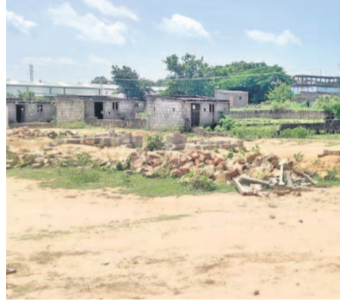
సర్వే నంబర్ 840లో నిర్మించిన ఇండ్లు

చెన్నూర్, సెప్టెంబర్ 15 : కొన్నేళ్లక్రితం చెన్నూర్ పట్టణంలోని సర్వే నంబర్ 840లోని ప్రభుత్వ భూమి (బిల్దాదాఖల్)ని ఫ్లాట్లు చేసి అమ్మకానికి పెట్టగా, సమీప గ్రామాల ప్రజలు కొనుగోలు చేశారు. అందులో పెద్ద (ఇండ్లు) సైతం నిర్మించుకున్నారు. చెన్నూర్ గ్రామ పంచాయతీగా ఉన్నప్పుడు పెద్ద నిర్మించుకున్నవారికి అనుమతులు, ఇంటి నంబర్లు సైతం ఇచ్చారు. తర్వాత చెన్నూర్ మున్సిపాలిటీగా ఏర్పడిన తర్వాత కూడా పెద్ద కట్టుకున్న వారికి కూడా మున్సిపాలిటీ అధికారులు అనుమతులతో పాటు ఇంటి నంబర్లు ఇచ్చారు. ఇంతవరకు బాగానే ఉన్నా.. ప్రభుత్వ భూమిలో పెద్ద (ఇండ్లను) నిర్మించుకున్నారని, గతంలోని దస్తావేజులు మూడు రోజుల్లో సమర్పించాలని మున్సిపాలిటీ వారు నోటీసులు జారీ చేశారు. ఇటీవలే నోటీసులను సర్వే నంబర్ 840లో నిర్మించుకున్న ప్రతి ఇంటికి అంటించగా, యజమానులు ఆందోళన వ్యక్తం చేస్తున్నారు. గతంలో దరఖాస్తు చేసుకుంటే అనుమతులతో పాటు ఇంటి నంబర్లు కూడా ఇచ్చారని, ఈ వివరాలు మున్సిపాలిటీ ఆఫీసర్లతో కూడా ఉన్నాయని వారు చెబుతున్నారు. ఇది ప్రభుత్వ స్థలమైతే అప్పట్లో అధికారులు తమకు అన్ని రకాల అనుమతులు, ఇంటి నంబర్లు ఎలా ఇచ్చారంటూ ప్రశ్నిస్తున్నారు. అప్పట్లో అన్ని రకాల దస్తావేజులు సమర్పించిన తర్వాతే తమకు ఇంటి నంబర్లు ఇచ్చారని, ప్రస్తుతం మరోసారి దస్తావేజులు సమర్పించమని నోటీసులు ఎదురు ఇచ్చారో అతుకుటద్దం లేదని వారు పేర్కొంటున్నారు. అప్పట్లో