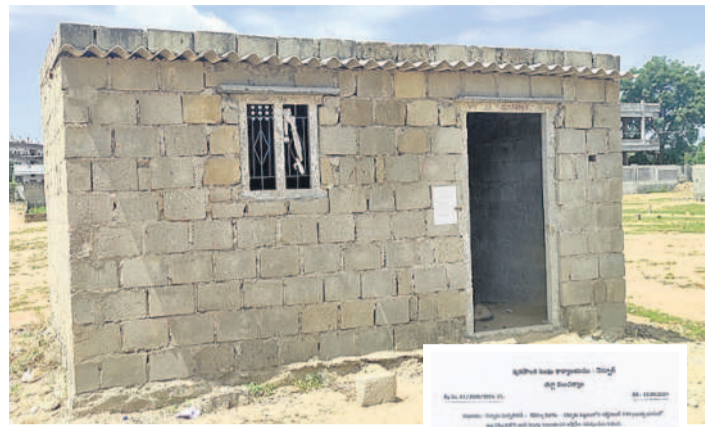
ఇండ్లకు మున్సిపాలిటీ వారు అంటించిన నోటీసు

స్థావరాలను బట్టి భవనాలు, పెద్ద నిర్మించుకున్నారు. అప్పట్లోనే అధికారులు అప్పడుంటే తాము ఇంటి స్థలాలను కొనుక్కునే వారమే కాదని వారు చెబుతున్నారు. అధికారుల తీరుతో అన్యాయం అవుతోంది. అక్రమ నిర్మాణాలకు అనుమతులు, ఇంటి నంబర్లు ఎలా కేటాయింబారు అనే విషయాలపై విచారణ జరిపి, అందుకు బాధ్యులైన అధికారులపై తగిన చర్యలు తీసుకోవాలని పలువురు డిమాండ్ చేస్తున్నారు. ప్రభుత్వ స్థలంలో నిర్మించిన ఇండ్లకు నోటీసులు జారీ చేసే విషయంపై వివరణ కోరేందుకు మున్సిపాలిటీ కమిషనర్ గంగాధర్ను ప్రయత్నించగా అందుబాటులో లేరు.