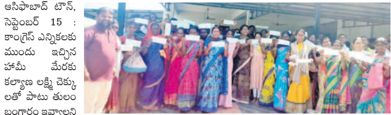
కల్యాణ లక్ష్మి చెక్కులు అందుకున్న లక్షాధికారులతో ఆసిఫాబాద్ ఎమ్మెల్యే కోవలక్ష్మి ఆసిఫాబాద్ ఎమ్మెల్యే కోవలక్ష్మి డిమాండ్ చేశారు. ఆదివారం జిల్లా కేంద్రంలోని ఎమ్మెల్యే కార్యాలయంలో 40 మందికి కల్యాణ లక్ష్మి చెక్కులు పంపిణీ చేశారు. ఆమె మాట్లాడుతూ ప్రభుత్వం ఆరు గ్యారంటీల అమలులో పూర్తిగా విఫలమైందని మండిపడ్డారు.