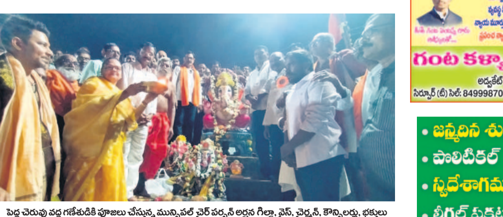
పల్ల చెరువు వద్ద గణేశుడి పూజలు చేస్తున్న మున్సిపల్ వైర్ల వైర్లస్, కొండా, భక్తులు

గతంలో వ్యాన్లు, ట్రక్కులు, లారీల్లో పశువులను అక్రమంగా తరలించిన స్వగర్లు ఇప్పుడు కంటియన్డ్ర వాడుతున్నారు. పరిమితికి మించి కంటియన్డ్రలో కిక్కిరిసి ఎక్స్‌ప్రెస్‌లలో పల్ల మూగ జీవాలు ఊపిరాడక మృత్యు వాత పడుతున్నాయి. ఇటీవల రెచ్చెన్లో పట్టుబడక కంటి