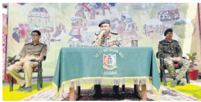
మాట్లాడుతున్న ఉమ్మడి ఎన్సీసీ జిల్లా కమాండింగ్ ఆఫీసర్ కల్వల్ వికాస్ శర్మ