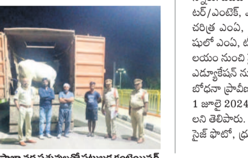
వాహనంలో పరిమితికి మించి ఎక్స్‌ప్రెస్‌లలో పట్టుబడ కంటియన్డ్ర

సంతల్లో కొనుగోలు చేసి.. రాత్రివేళల్లో తరలింపు