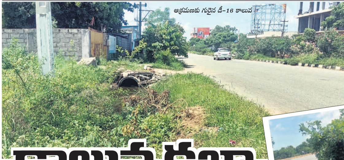
అక్షయకాంక్ష గుర్తించే 16-కాలం