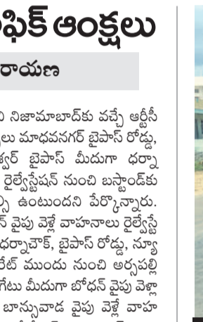
డ్రైనేజీ పనులు ప్రారంభం

వినియోగం, సెప్టెంబర్ 15 : జిల్లాకేంద్రంలో ఈనెల 17న గణేశ్ నిమజ్జన కార్యక్రమం సందర్భంగా ట్రాఫిక్ అంక్షలు ఉంటాయని ట్రాఫిక్ ఏసీసీ నాయణ అధికారం ఒక ప్రకటనలో తెలిపారు. ఉదయం 11 నుంచి మరుసటి రోజు అర్ధరాత్రి వరకు పంజాబ్ హైవే, ఇక్కడ వాహనాలకు నో ఎంట్రీ ఉంటుందని పేర్కొన్నారు. దుబ్బు చౌరస్తా నుంచి రైల్వేగేట్, గంజ్ కమాన్, గాంధీ చౌక్, నిఘంటువు, టి.ఎన్.టి.ఐ.సి, బి.ఎల్.ఐ.సి, గురుద్వారా, పెద్దబజార్ చౌరస్తా, గోల్ ట్యాంకు, పూలగార్ల చౌరస్తా మొదలైనవి వినియోగం అని ప్రకటించారు. ఈ పంటలను కాపాడుకోవడానికి సహకరించాలని కోరారు.