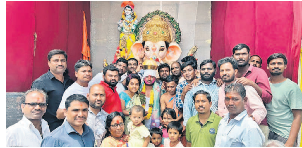
కాలూర్లో నిర్వహించిన వేలంలో లక్షలకు దక్కించుకున్న అమ్మవారి మండల నిర్వాహకులు

సారంగాపూర్/ కోటగిరి, సెప్టెంబర్ 15 : జిల్లాలోని రెండు గణేశ్ మండలాల వద్ద టోమ్మిడి రోజుల పాటు ఉంచిన లక్షల వేలంలో లక్ష రూపాయలకు పైగా అమ్మవారి మండలాలలోని కాలూర్ గ్రామంలో శ్రీ భవానీ పుత్ర గణేశ్ మండలి ఆధ్వర్యంలో ఏర్పాటు చేసిన మండలం లద్దా వేలం