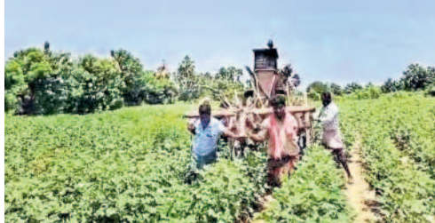
రాంపురం గ్రామంలో రైతుల అవస్థలు

భారీ వర్షాలతో మండలంలోని రాంపురం గ్రామంలో ఏడుగురికి వ్యవసాయ భూముల్లో ఏర్పాటు చేసిన ట్రాన్స్ఫార్మర్ కాలిపోయింది. వరద తాకిడికి రహదారి కొట్టుకుపోయింది. తమ పాఠాలు ఎండిపోతున్నాయని తెలిపిన విద్యుత్ అధికారులు నిర్దేశించినట్లు రైతులకు సహాయం అందిస్తూ ట్రాన్స్ఫార్మర్ను ఎత్తి కాడపట్టి పట్టి చేస్తే నుంచి తరలించారు. ఈ ఏడాది సాగే మిడియాలో వైరగా మారింది.