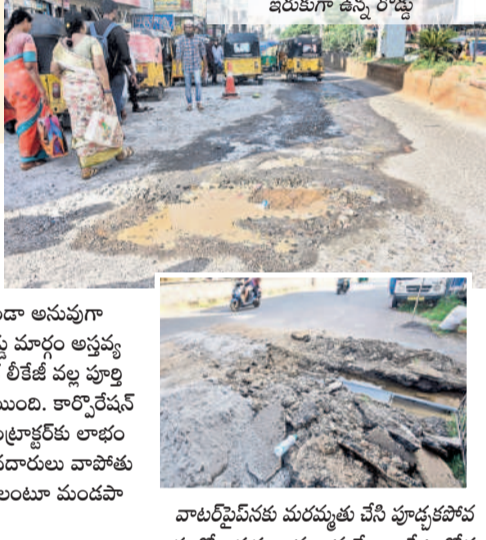
పోచమ్మపైదాన్ నుంచి దోశాయిపేటకు వెళ్లే మూల వద్ద గుంటలతో ఇరుకుగా ఉన్న రోడ్డు

వివిధ ప్రాంతాల్లో నవరాత్రులు పూజలందుకున్న వినాయక విగ్రహాలను డబ్బువస్త్రాల్లు, భూషణం, కిరీటాలు, నృత్యాలతో ఊరేగింపుగా తీసుకెళ్లి దోశాయిపేటలోని చిన్నవడ్డెపల్లి చెరువులో నిమజ్జనం చేస్తారు. ఊరేగింపు సాగే సాగలే రోడ్డు మార్గం గుంతులు లేకుండా అనువుగా ఉండాలి. కానీ, పోచమ్మపైదాన్ ఇంకా పక్కనే వద్ద రోడ్డు మార్గం అభివృద్ధి స్థానంగా తయారైంది. రెండు నెలల క్రితమే పునరుద్ధి లిఫ్ట్ పల్ల పూర్తి స్థాయిలో మరమ్మత్తులు చేపట్టారు. ఫలితం లేకపోయింది. కార్పొరేషన్ అధికారులు లక్షలాది రూపాయలు ఖర్చు చేసి కాంట్రాక్టర్లకు లాభం చేసుకోవడానికి ప్రభుత్వ బాధలు తీరలేదని వాహనదారులు వాపోతున్నారు. ఈ రోడ్డుపై ఎలా ప్రయాణం ఎలా చేయాలంటూ మండపాల నిర్మాణాకులు అందరినీ వ్యక్తం చేస్తున్నారు.