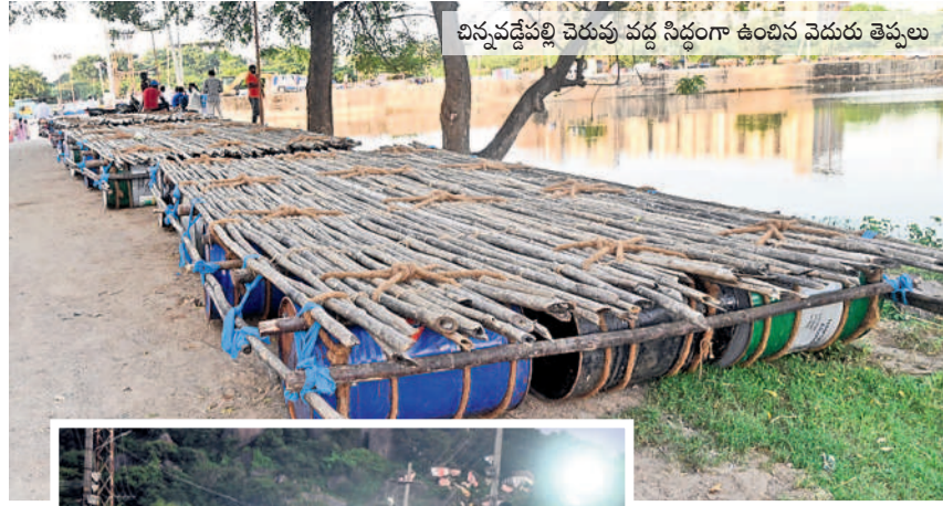
దినపక్షిపల్లి చెరువు వద్ద సిద్ధంగా ఉంచిన చెడురు తెప్పలు