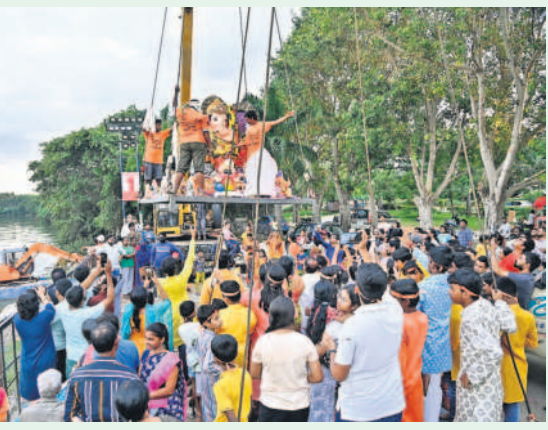
నెత్తెన్ రోడ్డులోని హుస్సేన్ సాగర్ జలాల్లో గణపతులను తరలిస్తున్న దృశ్యాల్ ను తిలకిస్తూ తమ సెల్ ఫోన్ లో బంధించుకుంటున్న భక్తులు