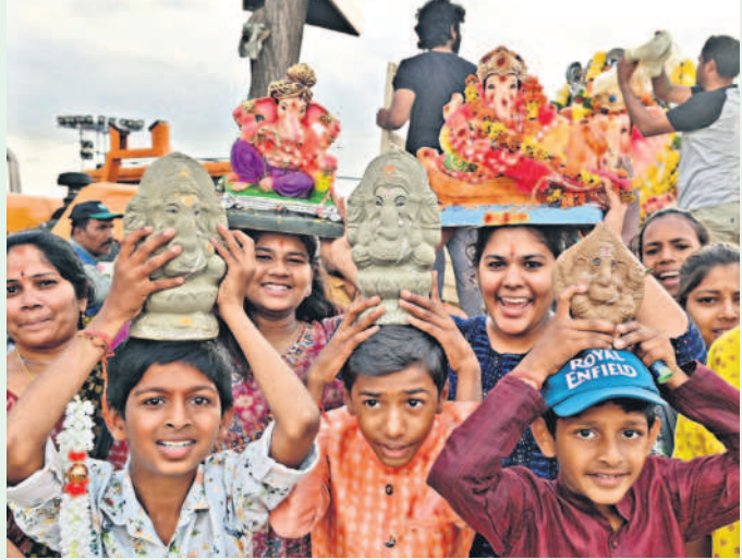
హుస్సేన్ సాగర్ కు నిమజ్జనానికి విఘ్నే రాజాలతో తరలివచ్చిన వినాయకులు