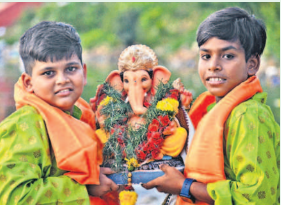
నెత్తెన్ రోడ్డులోని హుస్సేన్ సాగర్ కు విఘ్నేశ్వరున్ని తరలిస్తున్న వినాయకులు