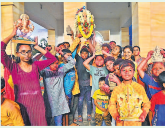
రాయదుర్గం - షేక్ పేట్ వలిదాల్లోని మల్లం చెరువుకు గణనాథులతో తరలివచ్చిన వినాయక భక్త బృందం