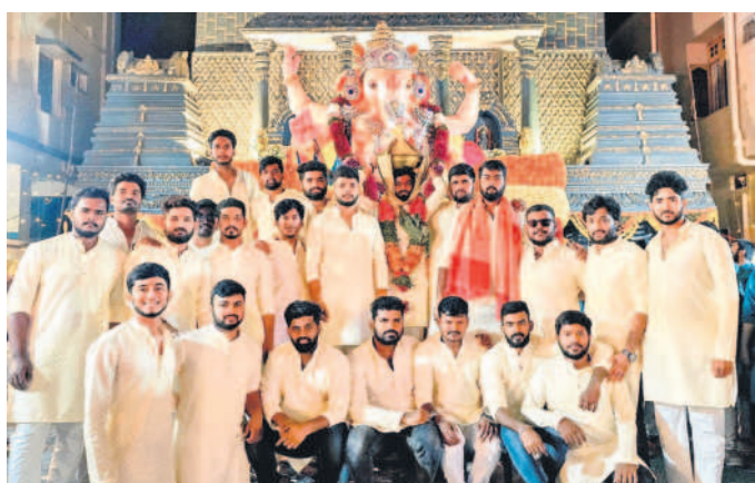
ఫ్రెండ్స్ వినాయకుడి లడ్డూ @రూ. 3.15 లక్షలు