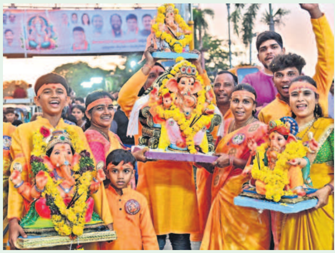
వినాయకులను హుస్సేన్ సాగర్లో నిమజ్జనం చేసేందుకు తరలివచ్చిన భక్తులు

నగరం తొమ్మిది రోజుల పాటు గణనాథుని కొలువులో భక్తి పారవశ్యంలో తలమునక లైంది. వినాయక నవ రాత్రి భక్తుల పూజాది కాలతో ఉత్సాహాలు ఘనంగా జరిగాయి.