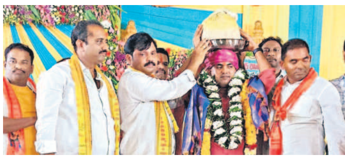
మాతృశ్రీ నగర్ వెటర్నీ అసోసియేషన్ ఆధ్వర్యంలో..