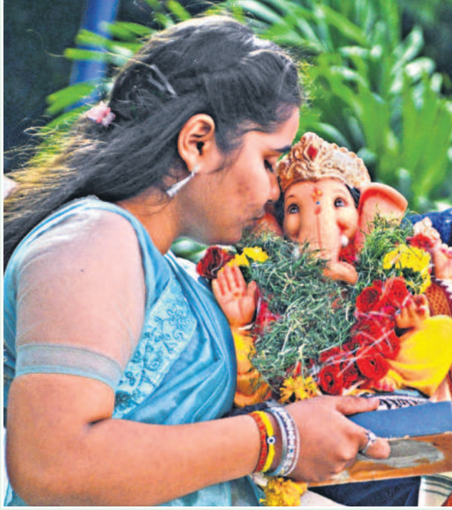
తోమ్మిది గోజులు భక్తి శ్రద్ధలతో కొలిచిన గణనాథుని నిమజ్జన నిమిత్తం నెత్తెన్ రోడ్డులోని హుస్సేన్ సాగర్ కు ఆదివారం తరలిస్తూ అనంతరం, తన మదిలోని కోరికను తీర్చుమని గణపయ్య చెవిలో గోప్యంగా చెబుతున్న ఓ యువ భక్తురాలు

నగరం తొమ్మిది రోజుల పాటు గణనాథుని కొలువులో భక్తి పారవశ్యంలో తలమునక లైంది. వినాయక నవ రాత్రి భక్తుల పూజాది కాలతో ఉత్సాహాలు ఘనంగా జరిగాయి.