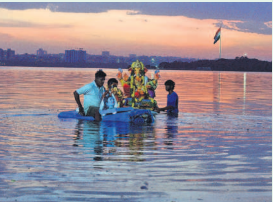
నెత్తెన్ రోడ్డులోని హుస్సేన్ సాగర్ జలాల మధ్యకు వెళ్లి విఘ్నే రాజుకు నిమజ్జనం చేస్తున్న భక్తులు