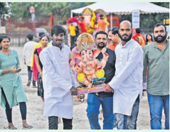
నెత్తెన్ రోడ్డులోని హుస్సేన్ సాగర్ కు విఘ్నేశ్వరున్ని తరలిస్తున్న యువత