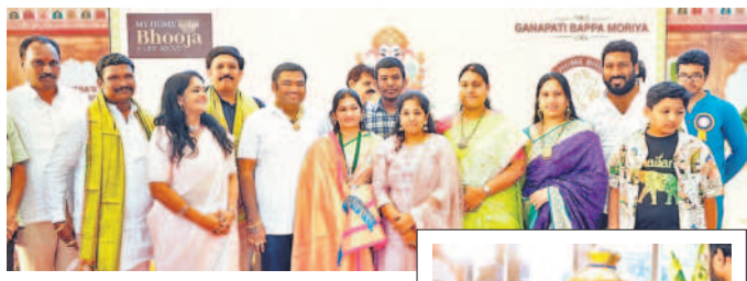
రూ. 29 లక్షలకు మైవోన్ భూజా లడ్డూ..

నాల్గో సీట్లోని మైవోన్ భూజా గేట్ కమ్యూనిటీలో వినాయకుడి లడ్డూ ఈ ఏడాది రికార్డు సౌయల్ రూ. 29 లక్షలకు అమ్ముడు పోయింది.