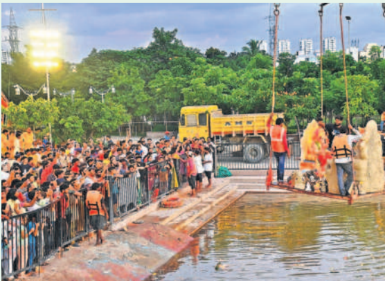
రాయదుర్గం - షేక్ పేట్ వలిదాల్లోని మల్లం చెరువులో భక్తుల కోలాహలం మధ్య గణనాథుల నిమజ్జనం