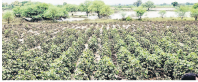
జైన్ మండలంలోని పెన్ గంగా ప్రవాహంతో నీటి మునిగిన పంటలు

చివరిదశలో ముంచిన వర్షాలు • సర్కారు సాయం పెట్టుబడులకు సరిపోదు