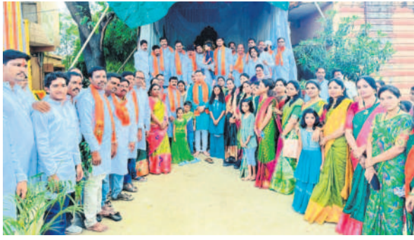
పూజ కార్యక్రమంలో పాల్గొన్న ఆదిలాబాద్ కట్టెక్క రాజ్యం పాఠశాల, రెవెన్యూ ఉద్యోగులు

ఎదులాపురం, సెప్టెంబర్ 15 : ఆదిలాబాద్ పట్టణంలోని రెవెన్యూ గెస్ట్ హౌస్ ఆవరణలో ఏర్పాటు చేసిన గణేశ్ మండపం వద్ద ఆది వారం కట్టెక్క రాజ్యం పాఠశాల పూజలు చేశారు. ఇందులో రెవెన్యూ అధికారులు, ఉద్యోగులు, తదితరులు పాల్గొన్నారు.