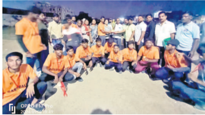
విజేతలుగా నిలిచిన బాలుర జట్టు