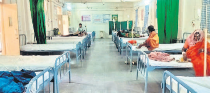
కోదాడ 30 పడకల దవాఖానలో వైద్య సేవలు అందక వెలవెలబోతున్న రోగుల వార్డు

30 పడకల దవాఖానలో ముగ్గురే వైద్యులు ముగ్గురే వైద్యులు జనరేటర్ లేక చీకట్లో రోగుల అవస్థలు సర్కారులో సేవలు అందక పైవేటి దవాఖానలకు.. వైద్యులును భర్తీ చేసి వసతులు కల్పించాలని వేడుకోలు