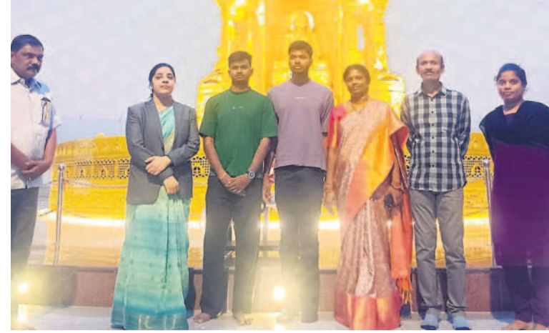
బుద్ధవనంలోని ధ్యాన మందిరంలో కుటుంబ సంభులతో హైకోర్టు న్యాయమూర్తి సృజన