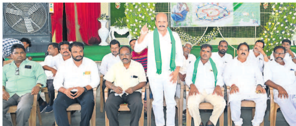
టీపుల్ ఆర్ భూ నిర్వాసితుల ఇక్కడ సమావేశంలో పాల్గొన్న అఖిలపక్షం నాయకులు