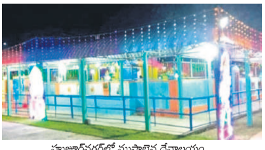
హుజూర్ నగర్లో ముస్తాబైన దేవాలయం