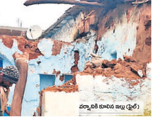
వర్కానికి కూలిన ఇల్లు (ఫైల్)

ఇంటి నిర్మాణానికి మరింత సాయమందించాలని ప్రభుత్వానికి బాధితురాలు వేడుకోలు