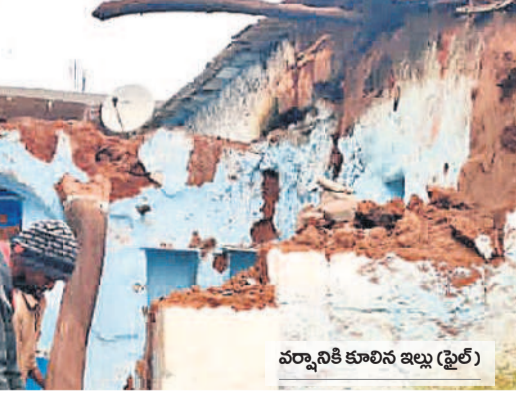
వర్షానికి కూలిన ఇల్లు (ఫైల్)

ఇంటి నిర్మాణానికి మరింత సాయమందించాలని ప్రభుత్వానికి బాధితురాలు వేడుకోలు