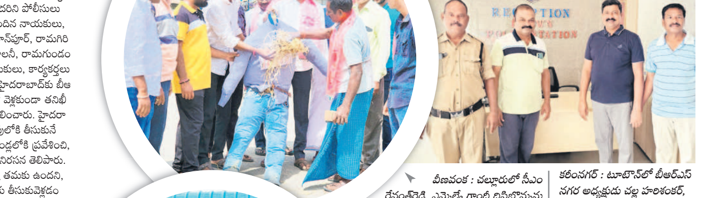
వీణవంక : చల్లూరులో సీఎం రేవంత్ రెడ్డి, ఎమ్మెల్యే గాంధీ దిప్తిబామ్మను దహనం చేస్తున్న బీఆర్ఎస్ నాయకులు