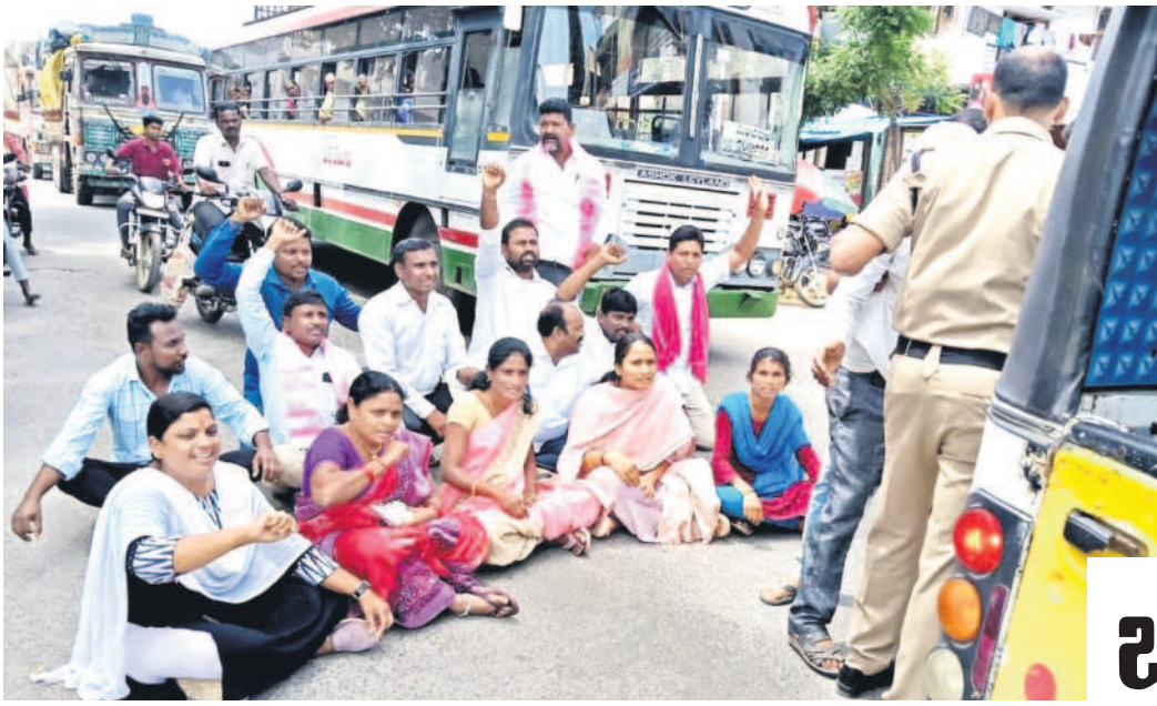
ధర్మాధరం : రాష్ట్ర రహదారిపై ధర్మా చేస్తున్న బీఆర్ఎస్ నాయకులు, కార్యకర్తలు