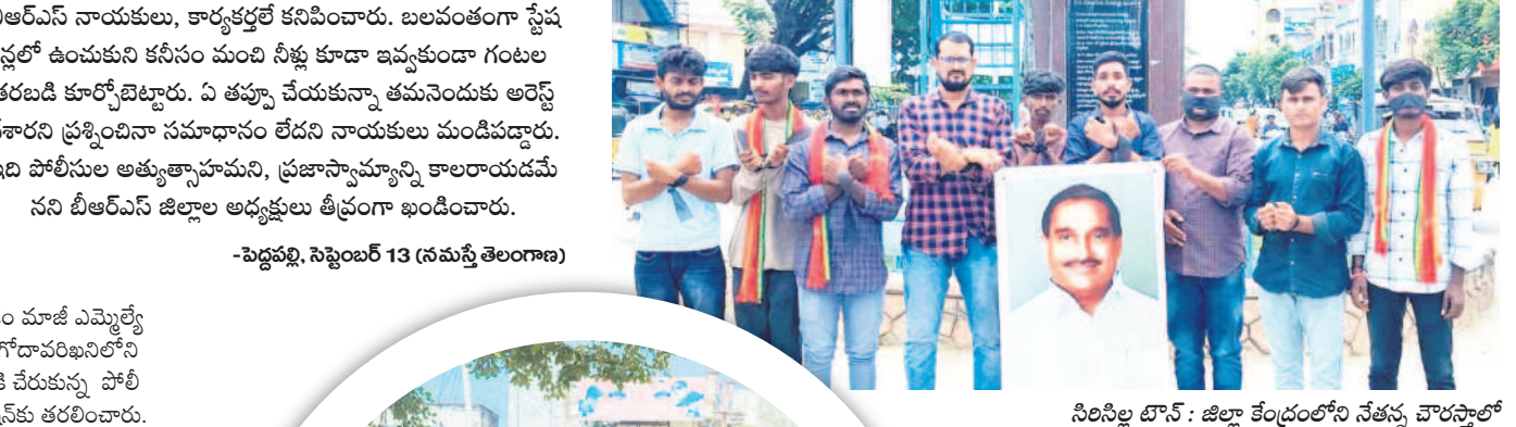
సినిపిల్ల టౌన్ : జిల్లా కేంద్రంలోని నేతన్న చౌలస్థాల్ నిరసన తెలుపుతున్న బీఆర్ఎస్ నాయకులు