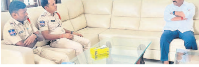
గంగాధర : బూరుగుపల్లిలో మాజీ ఎమ్మెల్యే రవిశంకర్ను హోం అరెస్ట్ చేసిన పోలీసులు