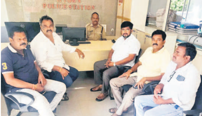
కరీంనగర్ కార్పొరేషన్ : టూ టౌన్ పోలీస్ స్టేషన్లో బీఆర్ఎస్ నాయకులు