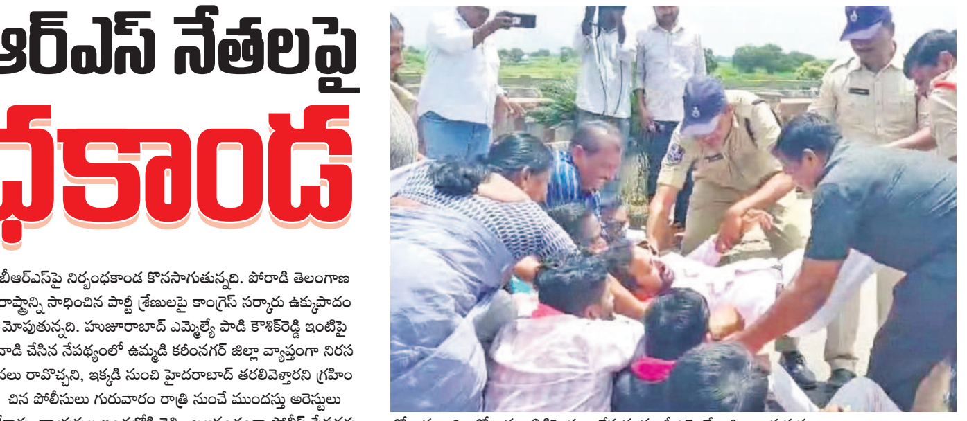
గోదావరిఖని : గోదావరి (బ్రిడ్జి)పై ధర్మా చేస్తున్న మాజీ ఎమ్మెల్యే, జిల్లా అధ్యక్షుడు కోడంకంటి చంద్రమౌళి అరెస్ట్ చేస్తున్న పోలీసులు