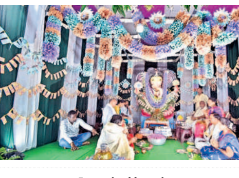
వరంగల్లో కరెన్సి అలంకరణలో గణనాథుడు