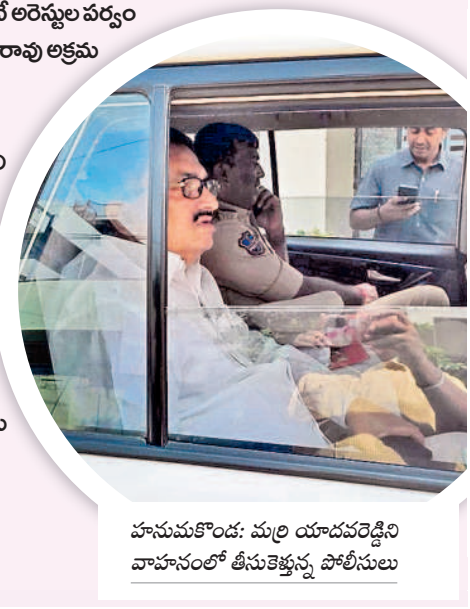
హనుమకొండ: మర్రి యాచార్యులపై వాహనంలో తీసుకెళ్తున్న పోలీసులు

ములుగు: బీఆర్ఎస్ కార్యకర్తలను తీసుకెళ్తున్న కానిస్టేబుల్