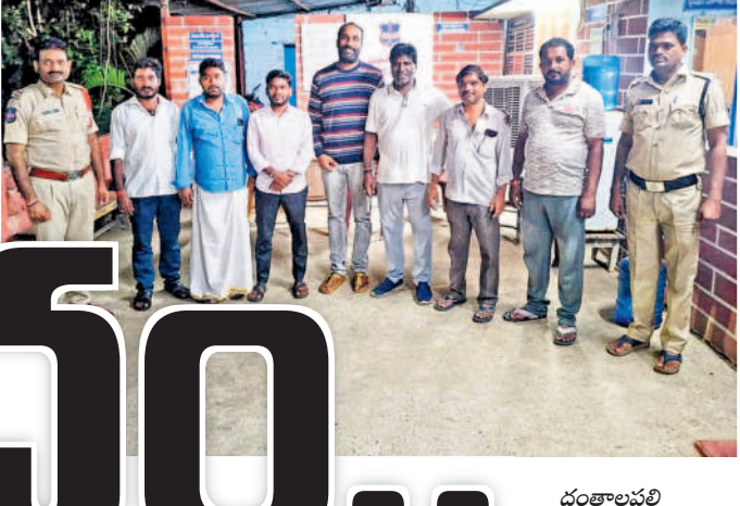
దంతాలపల్లి పోలీస్ స్టేషన్లో బీఆర్ఎస్ నాయకులను అక్రమంగా అరెస్టు చేసిన పోలీసులు

■ ప్రజాస్వామ్య విలువలను కాపాడాలి ■ అక్రమ అరెస్టులను ఖండించాలి ■ ఎమ్మెల్యే తక్కళ్ల పల్లి రవీంద్రరావు ధ్వజం