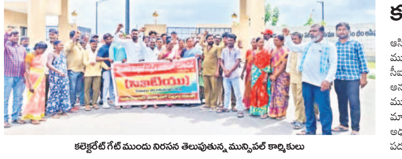
కలెక్టరేట్ గేట్ ముందు నిరసన తెలుపుతున్న మున్సిపల్ కార్మికులు