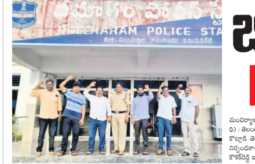
భీమారం పోలీస్ స్టేషన్ వద్ద నివాదాలు చేస్తున్న జి.అర్.ఎస్.సి. నాయకులు