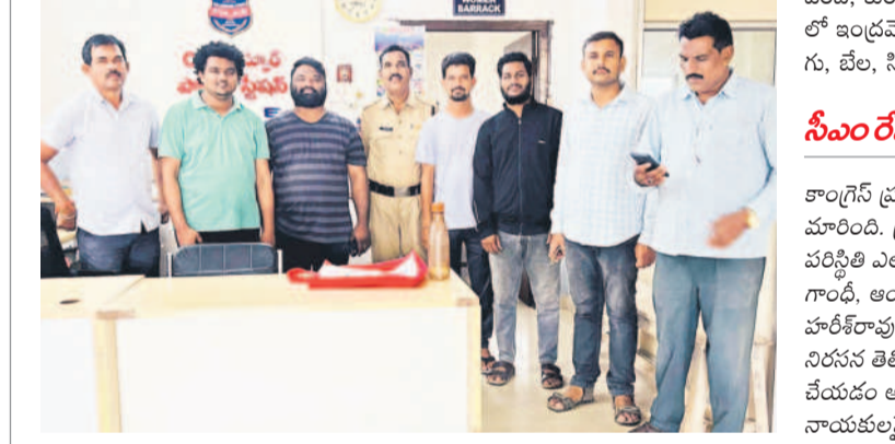
నన్నూరులో పోలీసులు అరెస్టు చేసిన జి.అర్.ఎస్.సి. నాయకులు