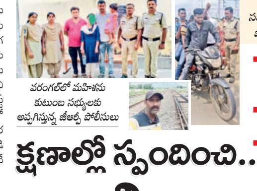
వరంగల్లో మహిళా కుటుంబ సభ్యులకు అప్పగిస్తున్న పోలీసు కానిస్టేబుల్