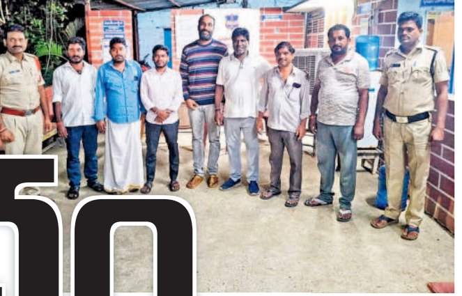
దంతాలపల్లి పోలీస్ స్టేషన్లో బీఆర్ఎస్ నాయకులను అక్రమంగా అరెస్టు చేసిన పోలీసులు