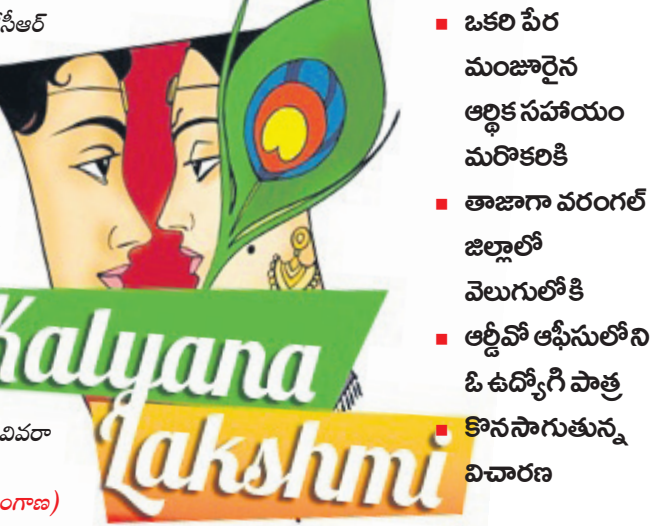
కల్యాణలక్ష్మి పథకంపై అక్రమార్కులు పక్కదారి పట్టిస్తున్నారని ఆరోపణలు

పేదలలో ఆదర్శ పేక్షి అందగా నిలిచే ఆర్థికంగా భారినేసేందుకు గత కేసీఆర్ సర్కారు ప్రవేశపెట్టిన కల్యాణలక్ష్మి పథకాన్ని కొందరు అక్రమార్కులు పక్కదారి పట్టిస్తున్నారు. ప్రభుత్వం నుంచి వచ్చిన దరఖాస్తుదారుల జాబితాలో ఇతరుల పేర్లు చేర్చి వారికి మంజూరైన ఆర్థిక సహాయాన్ని మరకొరి భాతాకు మళ్లిస్తున్నట్లు తెలిసింది. వరంగల్ జిల్లాలోని కొన్ని మండలాల్లో రెండేళ్లుగా ఈ తరంగం నడుచుకుంటూ సాయం మంజూరైనా ఇంకా అందలేదని దరఖాస్తుదారులు ఉన్నతాధికారుల వద్ద వ్యతిరేకం విషయం వెలుగులోకి వచ్చింది. కాగా అప్పటికే అక్రమార్కులు చెక్కులను డ్రా చేసుకోగా ఈ వ్యవహారంపై విచారణ మొదలైంది. ఇందులో ఆర్డీవో ఆఫీసులోని ఓ ఉద్యోగి పాత ఉన్నట్లు తేలగా, జిల్లాలో ఎన్ని మండలాల్లో ఎప్పుడైనా జరుగుతోంది? మొత్తం వచ్చిన దరఖాస్తులు, మంజూరైన వివరాల జాబితా, ఆర్డీవో ఆఫీస్ నుంచి బ్యాంకుకు పంపిన వివరాలపై ఆరా తీస్తున్నట్లు సమాచారం.