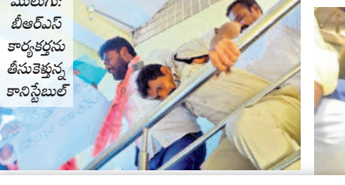
ములుగు: బీఆర్ఎస్ కార్యకర్తలను తీసుకెళ్తున్న కానిస్టేబుల్