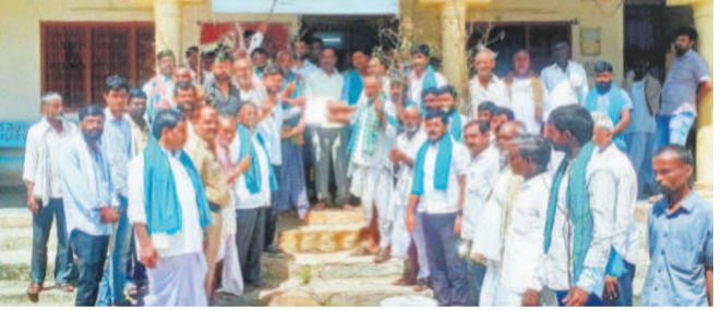
వర్షాలతో నష్టపోయిన పంటలకు ప్రభుత్వ పరిహారం ఇంకెప్పుడిస్తారంటూ తాసిల్దార్ కార్యాలయాన్ని ముట్టడించిన కామారెడ్డి జిల్లా పెద్దకోడవగల్ రైతులు