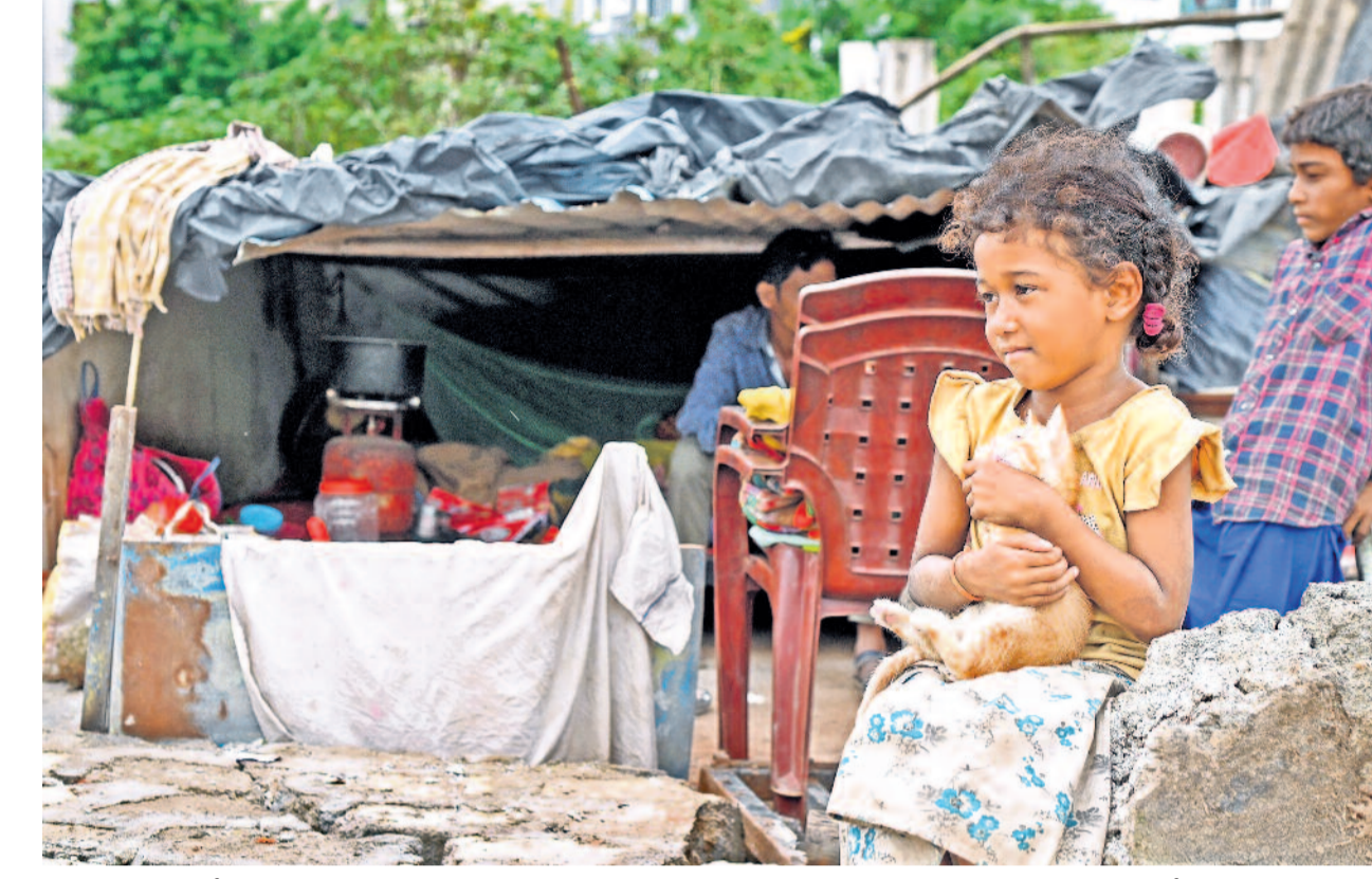
హైద్రా కూల్చితే తలతో గూడు చెరిగిన సున్నం చెరువు బాధితులు.. శిబిరా మధ్య ముక్కలైన బతుకుని వెతుక్కుంటున్నారు. ఇండ్లు నేలమట్టమై రోడ్డునవడిన కుటుంబాలు తాత్కాలికంగా వేసుకున్న టార్నాలిఫ్ కింద తలదాచుకుంటున్నాయి. తానేం పాపం చేశానంటూ అమాయకులు మాటలతోనే ఈ పాప ప్రభుత్వాన్ని ప్రశ్నిస్తున్నట్టుంది కదూ.