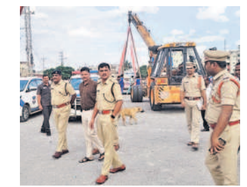
పటాన్చెరు సౌకి చెరువును పలిశీలిస్తున్న ఎస్పీ రూపేశ్

పటాన్చెరు, సెప్టెంబర్ 11 : పటాన్చెరు నియోజకవర్గంలోని బొలారం, అమీన్ఫూర్, పటాన్చెరు పోలీస్స్టేషన్ల పరిధిలోని చెరువు లను జిల్లా ఎస్పీ చెన్నూరి రూపేశ్, అదనపు ఎస్పీ సంజీవరావు, పటాన్చెరు డీఎస్పీ రవీం దర్రెడ్డిలతో కలిసి పరిశీలించారు. బుధవా రం పటాన్చెరు పట్టణంలోని సాకి చెరువు, అమీన్పూర్ మున్సిపాలిటీ పరిధిలోని బీరం గూడ శంబునికుంట, బొల్లారం చెరువుల్లో వినాయక విగ్రహాల నిమజ్జనాలు జరుగబో తున్నాయి. భారీ విగ్రహాలను ఇక్కడి చెరు వుల్లో నిమజ్జనం చేయనున్న నేపథ్యంలో పోలీసులు, మున్సిపల్ అధికారులు తీసుకుం టున్న చర్యలను ఆయన పరిశీలించి పలు సూచనలను చేశారు. జీహెచ్ఎంసీ ఉపకమి షనర్ సురేశ్తో ఏర్పాట్ల గురించి అడిగి తెలు సుకున్నారు. పోలీసు శాఖ, జీహెచ్ఎంసీ శాఖ