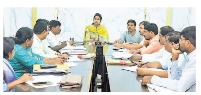
సమావేశంలో మాట్లాడుతున్న జిల్లా కలెక్టర్ వల్లూరు క్రాంతి