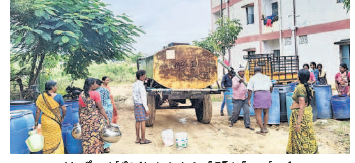
డ్రమ్ముల్లో తాగునీటిని పట్టుకుంటున్న డబుల్ బెడ్రరూమ్ కాలనీ వాసులు

లోని సిద్దాపూర్ సమీపంలో గల డబుల్ బెడ్ రూమ్ కాలనీ వాసులు తాగునీరు రాక పరే షాన్ అవుతున్నారు. పది రోజులుగా డబుల్ బెడ్రామ్ కాలనీ ప్రజలకు మిషన్ భగీరథ నీరు రావడం లేదు. దీంతో కాలనీ ప్రజలు తాగు నీటి కోసం గోస పడుతున్నారు. వానా కాలంలోనూ డబుల్ బెడ్రూమ్ వాసులకు నీటి తిప్పలు తప్పడం లేదు. డబుల్ బెడ్