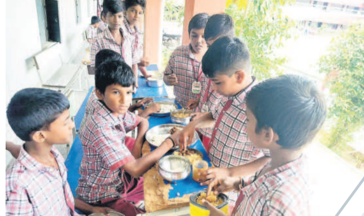
ఇంటి నుంచి తెచ్చుకున్న భోజనం తీసుకున్న విద్యార్థులు

ర్షలను ఖండించారు. ఎటువంటి కెమికల్స్ గానీ, రసాయన పదార్థాలు వినియోగించడం లేదని స్పష్టం చేశారు. పాల్యూషన్ కంట్రోల్ బోర్డు అనుమతులతో శాస్త్రీయంగా పర్యావరణానికి ఎటువంటి హాని లేకుండా పాలు, పాల పదార్థాలు ప్రాసెస్ చేస్తున్నామని తెలిపారు. బాయిల్ చిమ్నీ ద్వారా బూడిద పైకి వస్తుందనీ, పొగ వ్యాప్తి జరుగుతుందనీ చేసిన ఆరోపణను కొట్టిపారేశారు. చిమ్నీ బూడిద ద్వారా పొగ బయటకు వ్యాప్తి చెందదనీ, ఇది కూడా పాల్యూషన్ కంట్రోల్ బోర్డు సూచన మేరకు నడుస్తుందన్నారు. పాలు, ఇతర పదార్థాల తయారీ ప్రాసెస్ నిమిత్తం వినియోగించే నీటిని ఎంప్లయింట్ ట్రీట్మెంట్ ప్లాంట్ (కాటిజ్) ద్వారా శుద్ధి చేస్తూ తిరిగి డెయిలీ అవసరాలకు వినియోగిస్తున్నామనీ, దీని వల్ల ఎలాంటి గ్రౌండ్ వాటర్ పాల్యూషన్ కాదనీ స్పష్టం చేశారు. డెయిలీ పై లక్ష మంది పాడి రైతుల ఆధారపడి ఉన్నారనీ, ఈ నేపథ్యంలో డెయిలీపై అసత్య ఆరోపణలు చేసే వారు ఒకటి రెండుసార్లు ఆలోచించుకోవాలని సూచించారు. డెయిలీలో ప్రతి పని నిబంధనలకు లోబడి మాత్రమే ఉందనీ, అసత్య ఆరోపణలను ప్రజలచేర్చారా నమృతద్దిన విజ్ఞప్తి చేశారు.