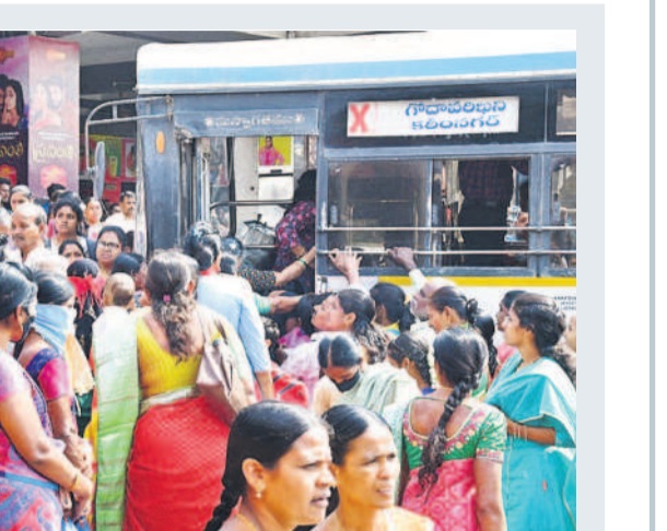
కలీంగర్ బస్సుషన్ లో బస్సుకుతున్న మహిళలు

అనుమతి లేకుండా స్కూల్ బయటకు వెళ్లింట్లు ఉపాధ్యాయులకు ఇన్ చార్జ్ డీకాన్ ఆదేశం పెద్దపల్లి కమాన్, సెప్టెంబర్ 11 : పాఠశాల పని వేళల్లో ప్రధానోపాధ్యాయులు అనుమతి లేకుండా ఉపాధ్యాయులు బయటకు వెళ్లింట్లు పెద్దపల్లి ఇన్ చార్జ్ డీకాన్ జనార్దన్ రావు ఆదేశించారు. సుల్తానాబాద్ ప్రభుత్వ ఉన్న పాఠశాలలో పని చేస్తున్న ఒక ఉపాధ్యాయుడు సదరు ప్రధానోపాధ్యాయుడి అనుమతి లేకుండానే పెద్దపల్లి డీకాన్ కార్యాలయానికి వెళ్లింట్లు తెలిపింది. దీనిపై హెచ్.ఎం.వి వివరణ కొరగా, తనకు చెప్పకుండానే స్కూల్ పని వేళల్లో మధ్యాహ్నం 12.25 గంటలకు ఉపాధ్యాయుడు బయటకు వెళ్లింట్లు చెప్పారు. ఈ విషయంపై ఉపాధ్యాయుడిపై చర్యలు తీసుకునేందుకు ఇన్ చార్జ్ డీకాన్ ఆదేశాలు జారీ చేశారు. స్కూల్ నుంచి బీచ్ వద్ద బయటకు వెళ్లింట్లు వస్తే ప్రధానోపాధ్యాయులు అనుమతి తీసుకొని, మామంబల్ రేజిస్ట్రార్ రాసి వెళ్లింట్లు తీసుకుంటుంటే ఉపాధ్యాయులు, సిబ్బందికి సూచించారు. ఎవరైనా నిబంధనలు అతిక్రమిస్తే చర్యలు తీసుకుంటామని హెచ్చరించారు.