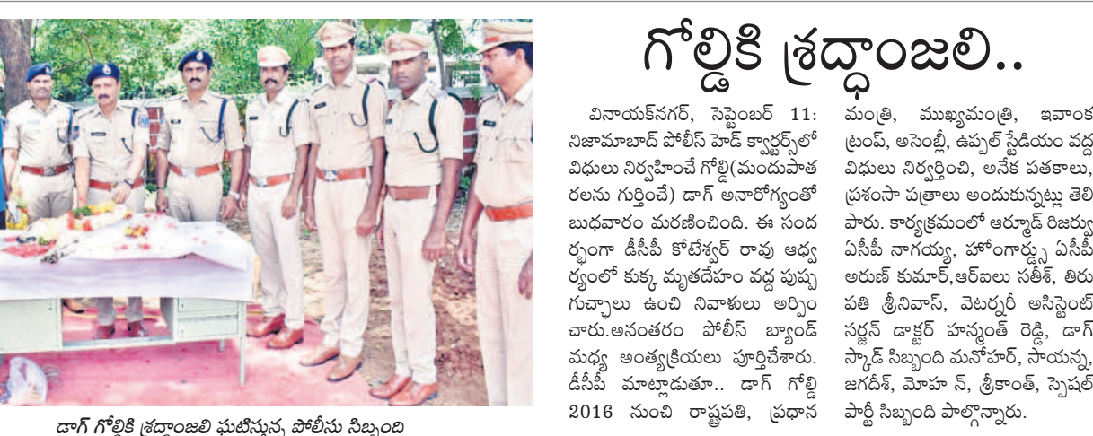
దాగ్ గోల్కొండ శ్రద్ధాంజలి పుటిస్తున్న పోలీసు సిబ్బంది

దూరభారం తగ్గుతుంది.. జిక్సన్ పల్లిలో ఎయిర్పోర్ట్ ఏర్పాటు కోసం రాష్ట్ర ప్రభుత్వం విజ్ఞప్తి చేస్తోంది. మట్లపల్లి జిల్లాలో ముఖ్యంగా బతుకుదెరువు కోసం విదేశాలకు వెళ్లే వారు ఎక్కువగా ఉన్నారు. వారందరికీ దూర భారం తగ్గుతుంది. గోల్కొండకు దృష్టిలో ఉంచుకొని రాష్ట్ర ప్రభుత్వం ఎయిర్పోర్ట్ ఏర్పాట్లపై శ్రద్ధ చూపాలి.