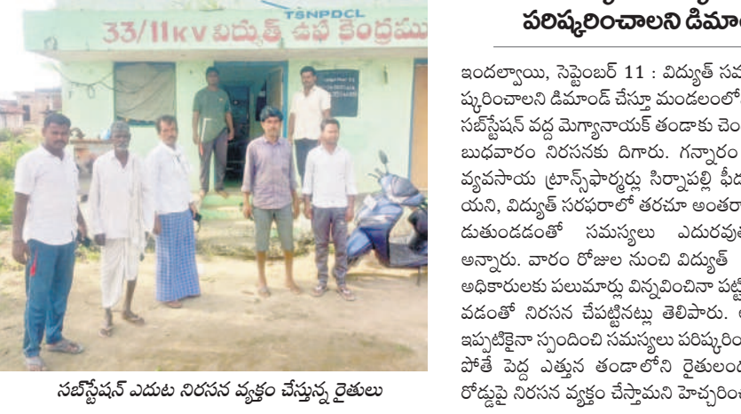
సబ్ స్టేషన్ ఎదుట నిరసన వ్యక్తం చేస్తున్న రైతులు