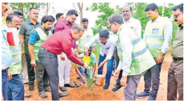
కొండా రెడ్డిపల్లి విద్యుత్ సబ్ స్టేషన్ లో కలెక్టర్ తో కలిసి మొక్క నాటి సీట్ల పోస్టును సీఎంఐ భరూభీ

బా డో ఇరిగేషన్ శాఖ మంత్రి ఉత్తమకమార్కర్లతో కలిసి విస్తృత చర్చలు జరిపారు. భారీ పరాల వల్ల వారికి పునరావాసం లేక ప్రజలు అక్కడే నివసిస్తున్నారు.