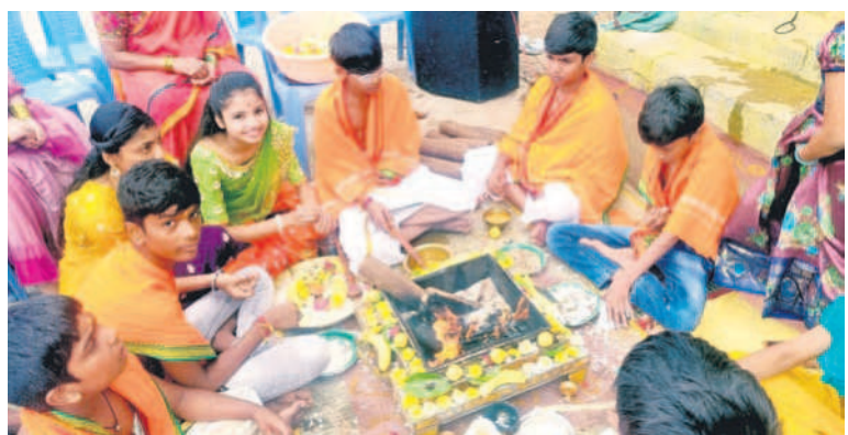
అచ్చంపేటలోని వినాయక మండపంలో శాంతిపూరితం నిర్వహిస్తున్న చిన్నాదులు