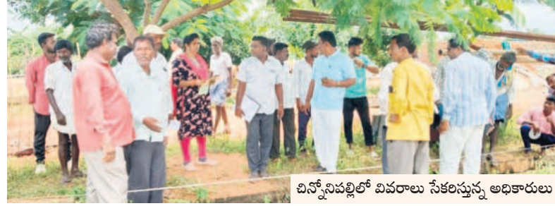
చిన్నోనిపల్లిలో వివరాలు సేకరిస్తున్న అధికారులు