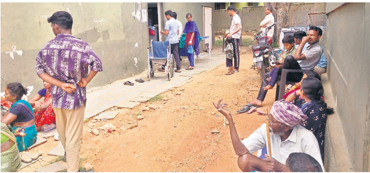
మన్మథూర్ దవాఖానం ఎదుట చికిత్స కోసం ఎదురుచూస్తున్న రోగులు

గట్టు, సెప్టెంబర్ 10 : చిన్నోనిపల్లిలో అధికారులు రెండో రోజు మరణం చేశారు. గట్టు తానీల్లాల్లో సరి తారాణి, ఇతర మండలాల తానీల్లాల్లో అధికారుల తిష్ట.