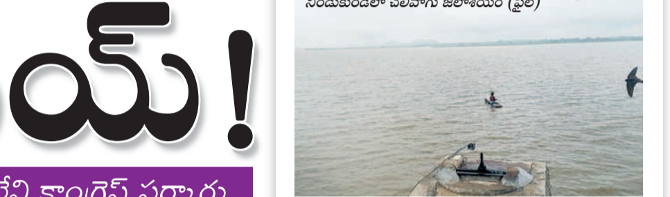
నిండుకుండలా పలివారు జలాశయం (ఫైల్)

వరంగల్, హనుమకొండ, జనగామ, మహాబూబాబాద్, ఇయ్యంకర్ భూపాలపల్లి, ములుగు జిల్లాలను సాగునీటి శాఖ వరంగల్, ములుగు యాని ట్టుగా వీధి ఇంజనీర్ ఆఫీసులు ఉన్నాయి. వరంగల్ యానిటీ వీధి ఇంజనీర్ పరిధిలో వరంగల్, మహాబూబాబాద్, జనగామ సర్కళ్లు.. ములుగు యానిటీ వీధి ఇంజనీర్ పరిధిలో ములుగు, నర్సంపేట సర్కళ్లు ఉన్నాయి. వరంగల్, ములుగు వీధి ఇంజనీర్ పరిధిలో 4,576 చెరువులు ఉన్నాయి. ఇటీవలి వానలతో 3,280 చెరువులు అలుగు పోస్తున్నాయి. మరో 954 చెరువులు పూర్తిగా నిండి ఉన్నాయి. 134 చెరువులు 75 వరకు నీళ్లు ఉన్నాయి. 24 చెరువులు సగం వరకు, 34 చెరువులు పావు వరకు నిండి ఉన్నాయి. సీజన్లో తీవ్రస్థాయిలో వానలు వచ్చిన మహాబూబాబాద్ జిల్లా పరిధిలోని అన్ని చెరువులు అలుగు పోస్తున్నాయి. వీటిలో పది వరకు చెరువుల కట్టలు తెగిపోయాయి. మహాబూబాబాద్ ఇరిగేషన్ సర్కిల్లో మొత్తం 674 చెరువులు మత్తడి పడుతున్నాయి. వరంగల్ సర్కిల్లోని 791 చెరువుల్లో 544 చెరువులు మత్తడి పడుతున్నాయి. ఈ సర్కిల్ పరిధిలోని 13 చెరువులు పావు వరకు మాత్రమే నిండి ఉన్నాయి. జనగామ సర్కిల్ పరిధిలో వానలు తక్కువగా ఉన్నాయి. రాష్ట్ర ప్రభుత్వం డేమాలు పరిధిలోని సాగునీరు సరఫరా చేయకపోవడంతో అన్ని చెరువులు నిండలేదు. ఈ సర్కిల్ పరిధిలోని 988 చెరువుల్లో 430 మత్తడి పోస్తున్నాయి. భూపాలపల్లి నియోజక వర్గ పరిధిలోని చెరువులకు పూర్తి స్థాయి నీళ్లు రాలేదు. ఈ డివిజన్ పరిధిలోని 586 చెరువుల్లో 234 చెరువులు మాత్రమే నిండి ఉన్నాయి.