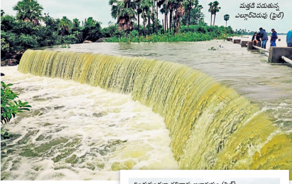
మత్తడి పడుతున్న ఎల్లారెవెరువు (ఫైల్)