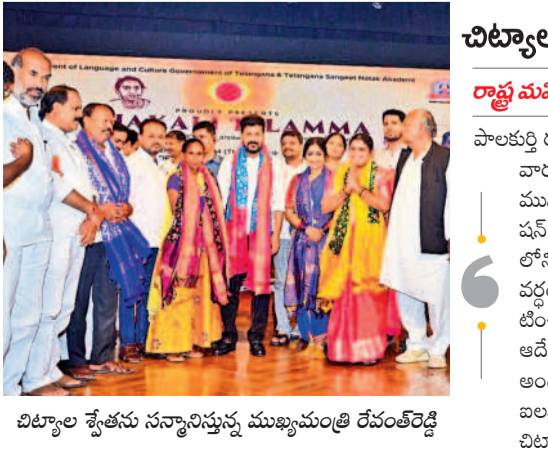
చిట్టాల శ్యామల సన్మానిస్తున్న ముఖ్యమంత్రి రేపంకొండ

ములుగు, సెప్టెంబర్ 10 (నమస్తే తెలంగాణ) : బతుకుదెరువు కోసం పెట్టుకున్న చిన్న చిన్న కిరాణా షాపులు, బడ్డీ కొట్టలో మద్యం అమ్మాలిందేనంటూ వ్యాపారులు ఓ ముఠాగా ఏర్పడి బెదిరిస్తున్నారు. మాట వింటే రోజూ ఆటోలో ఉదయం 9 గంటల లోపే మద్యం వస్తుందని, లేదంటే సాయంత్రం 5 గంటలకు అధికారులు వస్తారంటూ భయం పెడుతున్నారు. ములుగు జిల్లా వెంకటాపూర్ కిరాణా షాపులకు మద్యం అమ్మాలిందేనంటూ వ్యాపారులు ఓ ముఠాగా ఏర్పడి బెదిరిస్తున్నారు. మాట వింటే రోజూ ఆటోలో ఉదయం 9 గంటల లోపే మద్యం వస్తుందని, లేదంటే సాయంత్రం 5 గంటలకు అధికారులు వస్తారంటూ భయం పెడుతున్నారు. ములుగు జిల్లా వెంకటాపూర్ కిరాణా షాపులకు మద్యం అమ్మాలిందేనంటూ వ్యాపారులు ఓ ముఠాగా ఏర్పడి బెదిరిస్తున్నారు. మాట వింటే రోజూ ఆటోలో ఉదయం 9 గంటల లోపే మద్యం వస్తుందని, లేదంటే సాయంత్రం 5 గంటలకు అధికారులు వస్తారంటూ భయం పెడుతున్నారు.