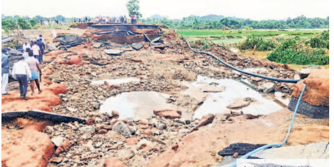
పురుషోత్తమాచార్యగౌడం వద్ద ధ్వంసమైన ఎస్హెచ్-365 (ఫైల్)