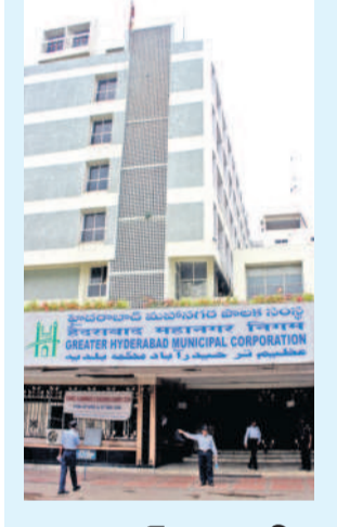
విజయవాడలో ఉనికి ప్రశ్నార్థకం! నిర్వహించిన అయోజ్యుల హైదరాబాద్ నుంచి రిటైర్ కాని పోలీస్ అధికారులు జీవో 58, 59 పని మరో చోట చేయడంపై ఉద్యోగుల్లో చర్చ