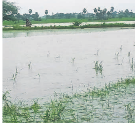
హుజూర్ నగర్ మండలం బూరుగడ్డలో నీట మునిగిన వరి పాలాలు

హుజూర్ నగర్ రూరల్, సెప్టెంబర్ 9 : కొద్ది రోజులుగా కురుస్తున్న వర్షాలకు చెరువులు నిండిపోతున్నాయి. అక్కడక్కడ గండ్లు పడు తున్నాయి. హుజూర్ నగర్ మండలంలోని బూరుగడ్డ గ్రామ చెరువుకు వరద ఉధృతి పెరుగడంతో నీళ్లు కట్ట మీద నుంచి పొంగి పొరాయి. థాంతో చెరువు కింద ఉన్న సుమారు 50 ఎకరాల వరి పంట నీట ముని గింది. నష్టపోయిన తమను ఆదుకోవాలని రైతులు ప్రభుత్వాన్ని కోరుతున్నారు.