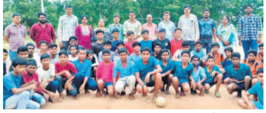
ఉమ్మడి నల్లగొండ జిల్లా హ్యాండ్లూమ్ బూరు జట్టుతో అధికారులు