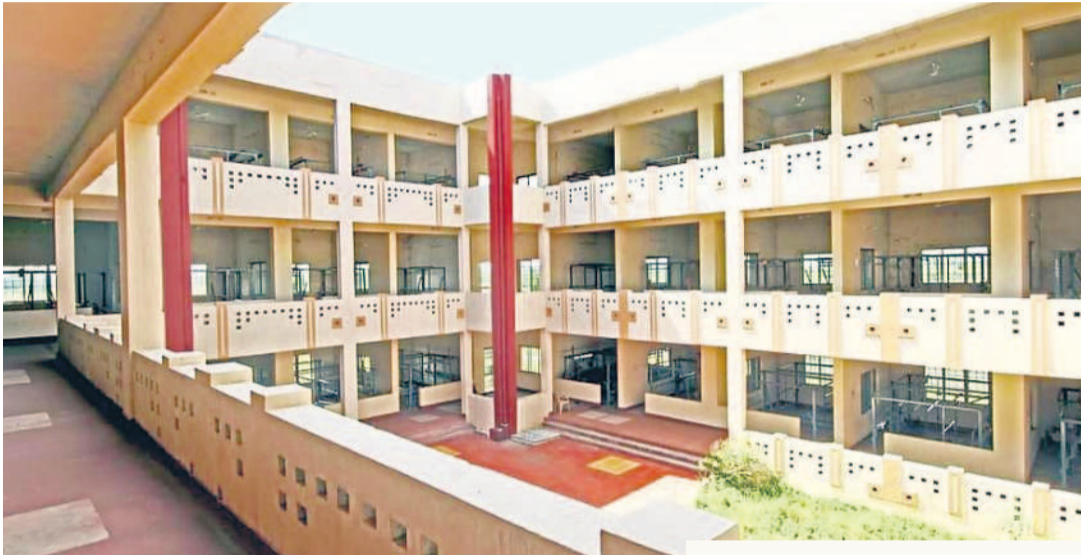
ఐఐఐఐటీ ఏర్పాటుకు కేటాయింబిన కనుమకుల్లోని హ్యాండ్లూమ్ పార్క్

రాష్ట్రంలో నలభై వేల చేనేత కుటుంబాలు ఉండగా, అత్యధికంగా భూదాన్ పోచంపల్లిలోనే నేత కార్మికులు ఉన్నారు. అనాదిగా వస్తున్న సంప్రదాయ పద్ధతులను నమ్ముకొని మగలపై వీరలు, చేనేత వస్త్రాలు ఉత్పత్తి చేస్తున్నారు. పెద్ద ఎత్తున వస్తు వ్యాపారం, తయారీ రంగం ఉంది. ప్రస్తుతం ఐఐఐఐటీలో కోర్సులకు మంచి డిమాండ్ ఉంది. తెలంగాణలో ఐఐఐఐటీ లేకపోవడంతో ఇతర రాష్ట్రాలకు తరలివెళ్ళాలని పరిస్థితి నెలకొంది. ఇది ఆర్థికంగా ఇబ్బంది కావడంతోపాటు, దూరభారం అవుతున్నది. ఇటీవల రాష్ట్రానికి కేంద్రం ఐఐఐఐటీ