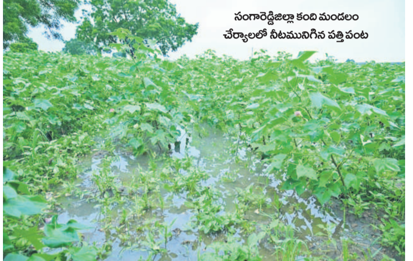
సంగారెడ్డి జిల్లా కంది మండలం చేరాలలో నీలముగిరిని పత్తి పంట

సిద్దిపేట, సెప్టెంబర్ 9 (నమస్తే తెలంగాణ ప్రతినిధి): ఉమ్మడి మెదక్ జిల్లా వ్యాప్తంగా రోజంతా వర్షంతో ప్రజలు తీవ్ర ఇబ్బందులు పడుతున్నారు. రాకపోకలకు తీవ్ర అటంకం ఏర్పడుతుంది. పంట పండిత నీలముగిరి పంటలు నష్టం పాలైపోయాయి. ఉమ్మడి జిల్లాలో భారీగా పంటలకు నష్టం వాటిల్లింది. సిద్దిపేట జిల్లాలో 4,172 ఎకరాలు, సంగారెడ్డి జిల్లాలో 5,078 ఎకరాలు, మెదక్ జిల్లాలో 500 ఎకరాలకు పంటలకు నష్టం వాటిల్లినట్లు ప్రాథమికంగా అందిన సమాచారం. ఉమ్మడి జిల్లాలో మొత్తం అన్ని రకాల పంటలు కలిపి సుమారుగా 9,750 ఎకరాలకు పంటలకు నష్టం వాటిల్లింది. ఇంకనూ పెరిగి అవకాశాలు ఉన్నాయి. పూర్తిగా అంచనా వివరాలు వచ్చి గానీ ఎంతో నష్టం జరిగింది అని తెలియజేసిన వ్యవసాయ శాఖ అధికారులు చెబుతున్నారు. వీరామం లేకుండా వచ్చిన వర్షాల వల్ల పంట పొలాలపై ప్రభావం పడుతుంది.