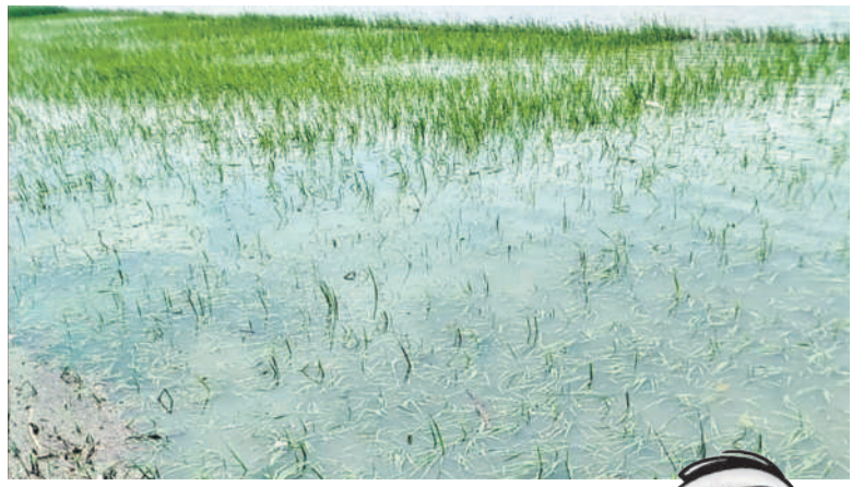
వర్గ : నెలూర్లో నీలముగిరిని రైతు బాలేలింగం పాలం