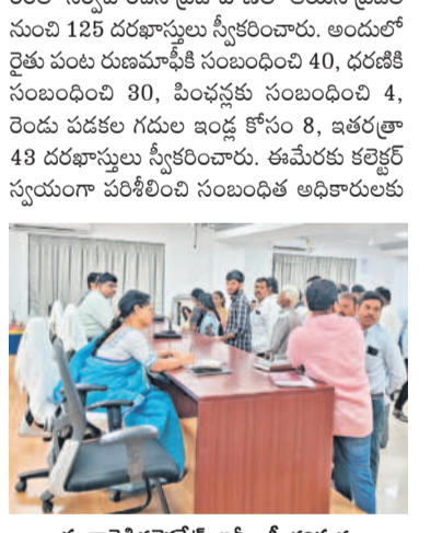
సంగారెడ్డి కలెక్టరేట్ : అధికారి స్వీకరిస్తున్న జిల్లా రెవెన్యూ అధికారి పర్యటింపించిన