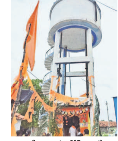
కర్ణి మండలం సుకృత కేంద్రంలో వాటర్ ట్యాంకు కింద ప్రతిష్ఠించిన వినాయక విగ్రహం

కర్ణి, సెప్టెంబర్ 9: వినాయక నవరాత్రి ఉత్సవాలు ఘనంగా కొనసాగుతున్నాయి. మండపాలను ఏర్పాటు చేసుకునేందుకు నిర్మాణాలు వారం రోజుల ముందు నుంచే ఏర్పాటు చేసుకుంటూ ఉంటారు. రేకు పెట్టె, చలవ పందిళ్ళు తదితర నామగ్రాంతి మండపాలు ఏర్పాటు చేసుకోవడం సరిపాటిగా చూస్తుంటారు. కానీ సంగారెడ్డి జిల్లా కర్ణి మండలం సుకృత కేంద్రం గ్రామంలో టీఆర్ఎస్ నుండి నిర్మించిన మిషన్ భగీరథ వాటర్ ట్యాంకు కింద పూజలందుకుంటున్న గణనాథుడు. రైతుల పెట్టెలను కింద ప్రతిష్ఠించిన వినాయక విగ్రహం