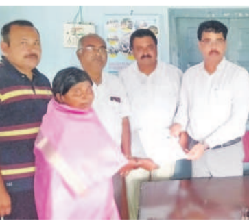
హద్దూర్ గ్రామ పంచాయతీ కార్యాలయంలో అంగీకార పత్రాలు అందజేస్తున్న రైతులు

న్యాయ కేంద్ర, సెప్టెంబర్ 9: నిమ్మ ప్రాజెక్టుకు భూములు ఇచ్చేందుకు రైతులు ముందుకొస్తే 15 రోజుల్లోనే పరిహారం అందజేస్తామని జిల్లా రాజాద్ నిమ్మ ప్రాజెక్టు డిప్యూటీ కలెక్టరేట్ రవీందర్ రెడ్డి అన్నారు. సోమవారం హద్దూర్ గ్రామ పంచాయతీ కార్యాలయంలో ఏర్పాటు చేసిన సమావేశంలో ఆయన పాల్గొన్నారు. ఈ సందర్భంగా మాట్లాడుతూ హద్దూర్ గ్రామానికి చెందిన 92 మంది రైతులు 112.972 ఎకరాల భూములను నిమ్మ ప్రాజెక్టుకు ఇచ్చేందుకు అంగీకరించారన్నారు. ప్రభుత్వం భూములు కోల్పోయిన బాధిత రైతులకు పరిహారం కింద రూ.16.83 కోట్లను మంజూరు చేసినదన్నారు. ఈ నిధులను సంబంధిత రైతుల బ్యాంకు ఖాతాల్లో ఆన్ లైన్ ద్వారా జమ చేస్తామని చెప్పారు. మండలంలోని గ్రామాల్లో రైతులు నిమ్మకు భూములు ఇచ్చినా, ఆసక్తి ఉంటే సంబంధిత అధికారులకు అంగీకార పత్రాలను అందజేయాలని సూచించారు. వారికి 15 రోజుల్లోనే ప్రభుత్వం నుంచి పరిహారం అందుతుందని చెప్పారు. భూములు ఇవ్వకుండా కోర్టుకు వెళ్లిన రైతులు కేసులను విరమించుకోవాలి ఉంటుందన్నారు. నిమ్మ ప్రాజెక్టుకు భూములు ఇస్తామని అంగీకారం