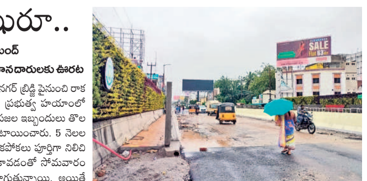
నయ్యానగల్ బ్రిడ్జి పైనుంచి పోతున్న వాహనాలు

నయ్యానగల్, సెప్టెంబర్ 9 : నయ్యానగల్ (బ్రిడ్జి) పైనుంచి రాక పోకలు ముద్రా అయ్యాయి. బీఆర్ఎస్ మండలం ప్రభుత్వ హయాంలో అప్పటి సీఎం కేసీఆర్ (బ్రిడ్జిని నిర్మించి ప్రజల ఇబ్బందులు తొలగించాలని ఉద్దేశంతో) రూ. 8 కోట్లను కేటాయించారు. 5 నెలల తీవ్ర పనులు చేపట్టగా, వాహనాల రాకపోకలు పూర్తిగా నిలిచి పోయాయి. ప్రస్తుతం నిర్మాణం పూర్తికావడంతో సోమవారం నుంచి వాహనాల రాకపోకలు కొనసాగుతున్నాయి. అయితే బ్రిడ్జిని అధికారింగా సీఎం రేవంత్ రెడ్డి పచ్చే నెలలో ప్రారంభించనున్నట్లు తెలిసింది.