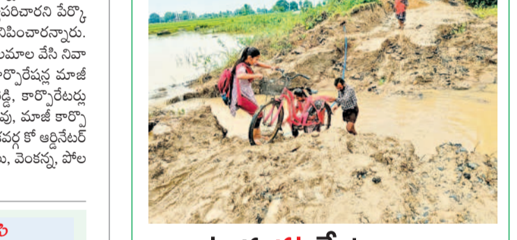
నర్సింహాలపేట, సెప్టెంబర్ 9

ఇటీవలి భారీ వర్షాలకు నర్సింహాలపేట మండలం జయపుర శివారు అన్నసారి కుంభం తెగిపోవడంతో తాత్కాలికంగా మట్టిపూసి తారు. అయితే శనివారం రాత్రి కుంభం వానకు మళ్ళీ మొదటికి రావడంతో ప్రజలు రాకపోకలకు జబ్బం పడుతున్నారు. బక్క తండా జీవ సహకార పోస్టాఫీసు, వకాలతండా, బండ్లమిఠిందా వాసులు, పోరాలకు వెళ్ళే విద్యార్థులు కుంభం కట్ట దాటేందుకు సర్కస్ స్టీలు చేయాలి వస్తున్నది. గత్యంతరం లేక తమ పిల్లలు తెగిన కుంభ మీదుగా వెళ్ళాలి వస్తున్నదని ఎమ్మెల్యే, సంబంధిత అధికారులు స్పందించి కట్టను బాగుచేయాలని ప్రజలు కోరుతున్నారు.