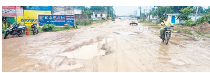
వీణవంకలో గంటలతో కరీంనగర్-జమ్మికుంట ప్రధాన రహదారి