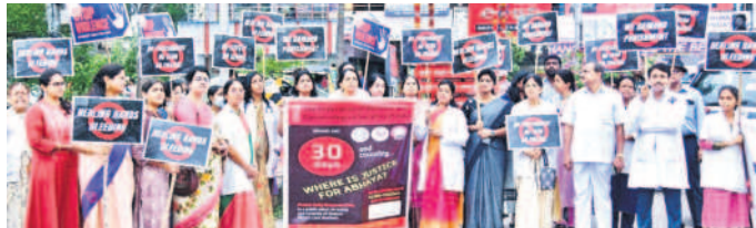
తెలంగాణపోకే వద్ద నిరసన తెలుపుతున్న డాక్టర్లు