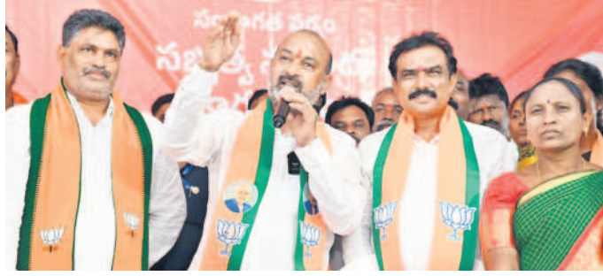
మాట్లాడుతున్న కేంద్ర హోం శాఖ సహాయ మంత్రి బండి సంజయ్