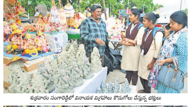
శుక్రవారం సంగారెడ్డిలో వినాయక విగ్రహాలు కొనుగోలు చేస్తున్న భక్తులు