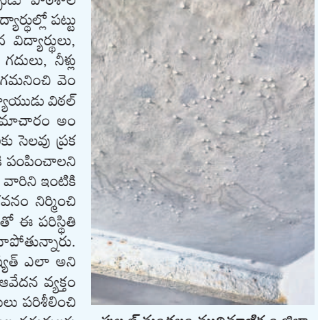
పుల్లూర్ మండలం ముదిమాణిక్యం జిల్లా పరిషత్ ఉన్నత పాఠశాల పైకప్పు నుంచి గదుల్లోకి వస్తున్న వర్షపు నీరు

పుల్లూర్, సెప్టెంబర్ 6: సంగారెడ్డి జిల్లా పుల్లూర్ మండలంలోని ముదిమాణిక్యం జిల్లా పరిషత్ ఉన్నత పాఠశాల ప్రమాదం అంచుకు చేరింది. ఐదు రోజులుగా కురుస్తున్న భారీ వర్షాలకు పాఠశాల గదుల్లోకి నీళ్లు చేరాయి. పురాతన బిల్డింగ్ కావడంతో స్టాబ్ మొత్తం బీటలుబారి వర్షపు నీళ్లు క్లాస్ రూమ్ లోకి వచ్చి అక్కడి నుంచి బయటకు వస్తున్నాయి. విద్యార్థులు బిక్కుబిక్కు పం