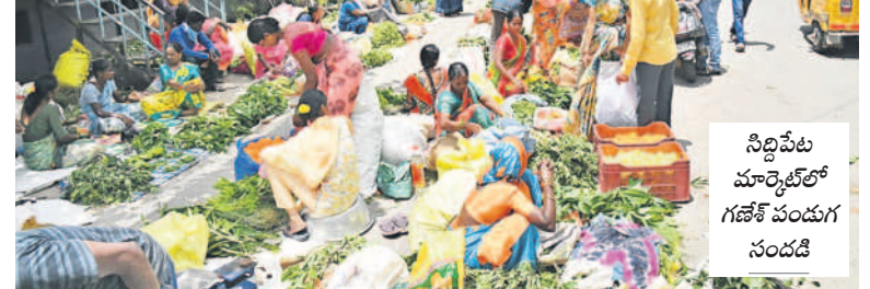
సిద్దిపేట మార్కెట్ లో గణేశ్ పండగ సందడి