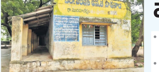
శిథిలావస్థకు చేరిన సంగారెడ్డి జిల్లా పుల్లూర్ మండలంలోని ముదిమాణిక్యం జిల్లా పరిషత్ ఉన్నత పాఠశాల