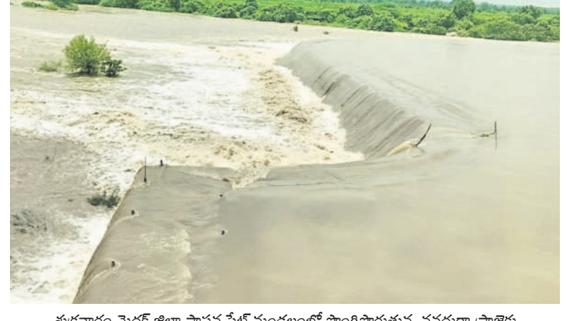
శుక్రవారం మెదక్ జిల్లా పాపన్నపేట్ మండలంలో పొంగిపొర్లుతున్న వనదుర్గా ప్రాజెక్టు