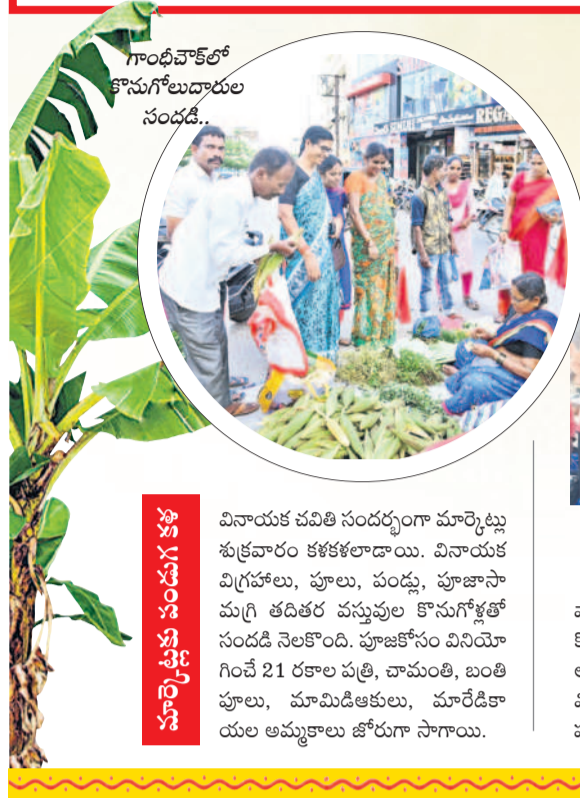
గాంధీచౌక్లో కొనుగోలుదారుల సందడి.. వినాయక చవితి సందర్భంగా మార్కెట్లకు శుభ్రవారం కళకళలాడాయి. వినాయక విగ్రహాలు, పూలు, పండ్లు, పూజాసామగ్రి తదితర వస్తువుల కొనుగోళ్లతో సందడి నెలకొంది. పూజాకోసం వినయోగించే 21 రకాల పత్రి, చామంతి, బంతి పూలు, మామిడిఆకులు, మారడీశాయల అమ్మకాలు జోరూ సాగాయి.