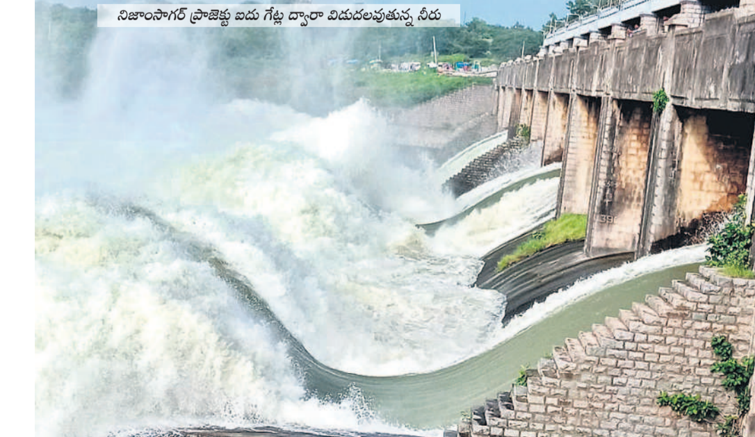
నిజాంసాగర్ ప్రాజెక్టు ఐదు గేట్ల ద్వారా విడుదలవుతున్న నీరు