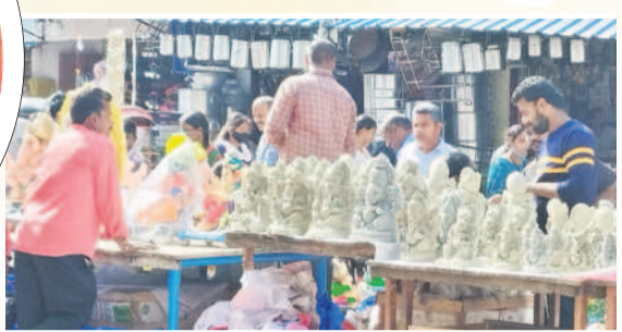
కామారెడ్డిలో మట్టి వినాయక ప్రతిమల విక్రయం

వినాయక చవితి అంటేనే ఆందోలం ఆదో ఉత్సాహం. ఊరూ వాడ కనిపించే సరికొత్త సంబురం. ఆకర్షణీయమైన మండపాలు.. అందులో కొలువుదీరే భారీ విగ్రహాలు. ఉదయం నుంచి ఆర్ధరాత్రి వరకు పూజలు, భజనలతో తొమ్మిది రోజుల పాటు సందడి కనిపిస్తుంది. శనివారం కొలువుదీరనున్న వినాయకుడి కోసం ఇప్పటికే మండపాలు ముసూపాలయ్యాయి. పట్టణాల్లోనే కాదు పల్లెల్లోనూ భారీ సెట్టింగులు కనిపిస్తున్నాయి.