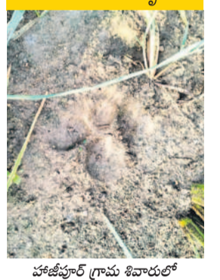
హజీపూర్ గ్రామ శివారులో చిరుత పాదముద్రలు

రుద్రూర్/ఎల్లారెడ్డి, సెప్టెంబర్ 6: ఉమ్మడి జిల్లాలోని పలు గ్రామాలలో కొన్నిరోజులుగా చిరుతల సంచారం ఆందోళన కలిగిస్తోంది. పల్లెల్లోకి ప్రవేశించి మూగజీవులను బలితీసుకుంటున్నాయి. దీంతో గ్రామస్థులు భయాందోళనకు గురవుతున్నారు. తాజాగా వచ్చి మంజీరం అటవీ డి ఫారం తండా లో గురువారం రాత్రి చిరుత దాడిలో ఓ దూడ మృతి చెందింది. హరింగుంకు చెందిన పశువుల పాకలోకి చొరబడిన చిరుత, అందులో కట్టిని ఉంచిన గేదెలు, దూడలపై దాడి చేసి ఓ దూడను హతమార్చింది. శుభ్రవారం ఉదయం గమనించిన యజమాని ఫారెస్టు అధికారి