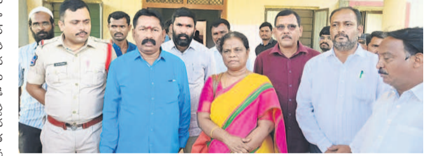
మీటన వివరాలను వెల్లడిస్తున్న అధికారులు