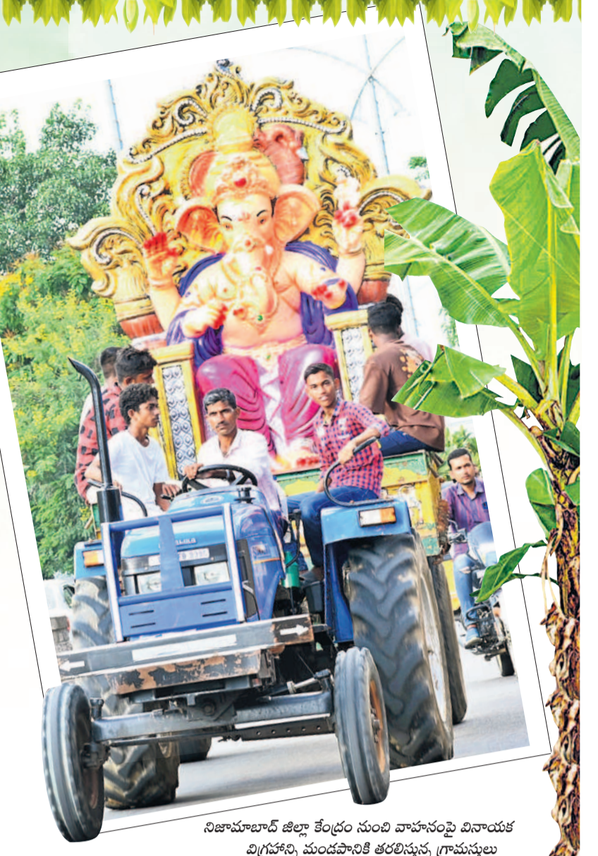
నిజామాబాద్ జిల్లా కేంద్రం నుంచి వాహనంపై వినాయక విగ్రహాన్ని మండపాలకు తరలిస్తున్న గ్రామస్థులు

నేడు (శనివారం) వినాయక చవితి సందర్భంగా ఉమ్మడి జిల్లాలోని వేలాది మండపాల్లో ఏకదంతుడిని ప్రతిష్ఠించనున్నారు. పార్వతీతనయుడి రాక కోసం ఒక్క కామారెడ్డి జిల్లాలోనే 8 వేలకు పైగా మండపాలు సిద్ధమయ్యాయి. నిజామాబాద్లో ఆ సంఖ్య మరింత ఎక్కువగా ఉంటుంది. విభిన్న ఆకృతుల్లో ముసూపైన గణపయ్యను మండపాలకు తరలింపే ప్రక్రియ రెండ్రోజుల నుంచి కొనసాగుతున్నది. శుక్రవారం కూడా ఆ సందడి కనిపించింది. మట్టి గణపయ్యలను కొనుగోలు చేసే వారి సంఖ్య ఈసారి కూడా బాగానే పెరిగింది. ప్లాస్టర్ ఆఫ్ పారీస్ (పివోపీ)తో తయారయ్యే విగ్రహాల పర్యావరణానికి ముప్పుగా పరిణమించిన నేపథ్యంలో ప్రజలు మట్టి గణపయ్యలకు ఇష్టపడుతున్నారు. మరోవైపు, కొన్ని స్వచ్ఛంద సంస్థల సైతం ఉచితంగా మట్టి విగ్రహాలను పంపిణీ చేస్తున్నాయి. అయితే, భారీ సెట్టింగులతో వేసే మండపాల్లో మాత్రం ప్లాస్టర్ ఆఫ్ పారీస్ (పివోపీ)తో తయారయ్యే వినాయకులను ప్రతిష్ఠించనున్నారు.