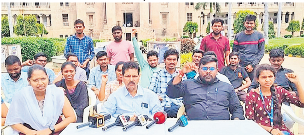
అర్చి కళాశాల ఆవరణలో విలేజులో సమావేశంలో నిందితుడైన అదివాసీ సంఘాల నాయకులు